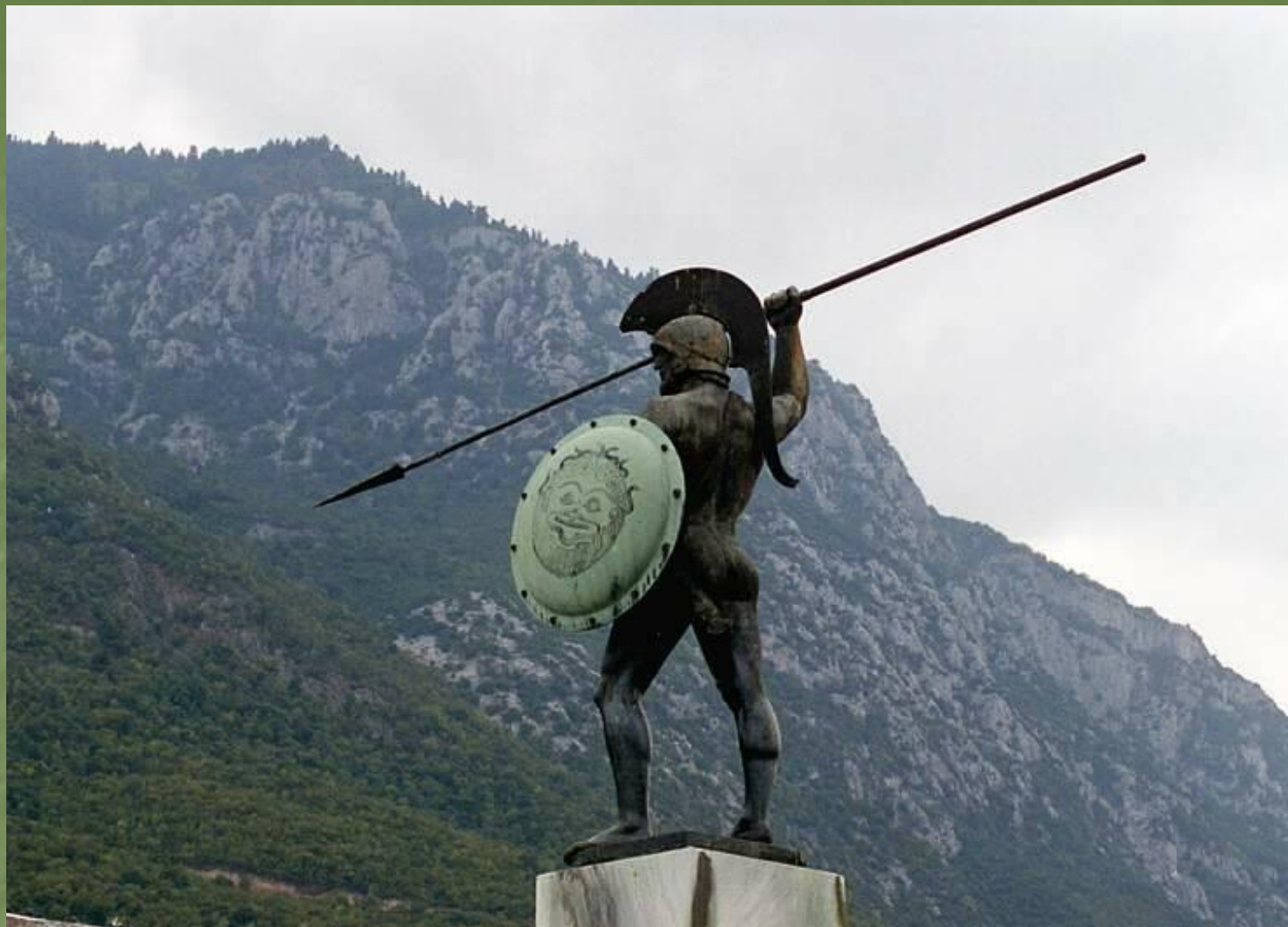
Монумент в честь защитников Фермопил