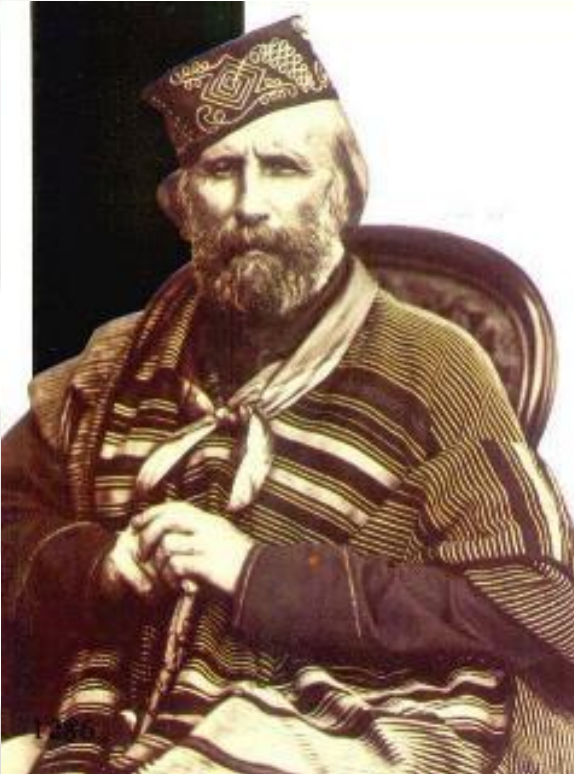
Камилло Бенсо ди Кавур (1810-1861 гг.)