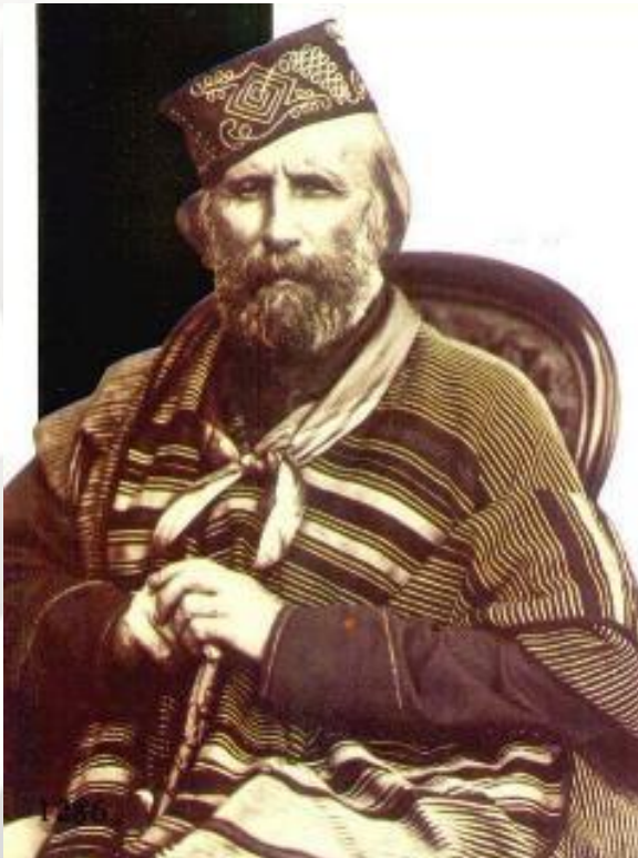
Камилло Бенсо ди Кавур (1810-1861 гг.)