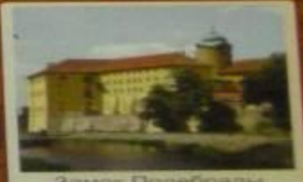
Замок Подебрады XII в. Чехия