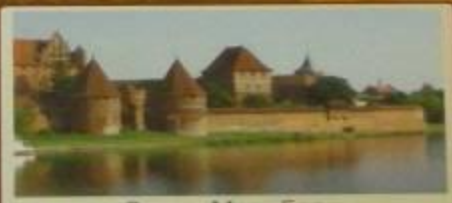
Замок Мальборк 1280 г. Польша