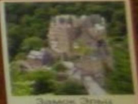
Замок Эльц 1157 г. Германия