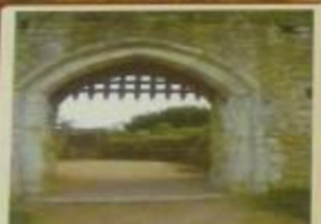
Ворота с решеткой