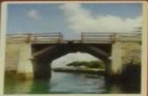
Подъемный мост через ров с водой