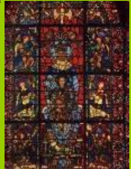
Витраж собора в Шартре