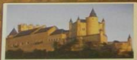
Замок Алькасар XI в. Испания