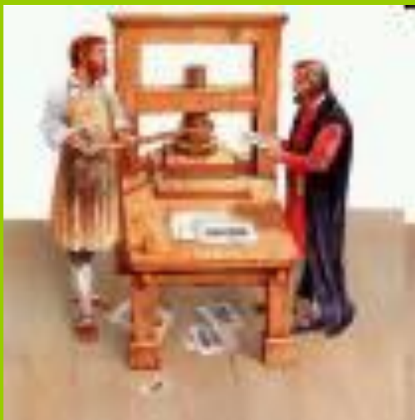
Печатный станок Иогана Гутенберга

Печатная книга – источник наших знаний появилась с средние века.