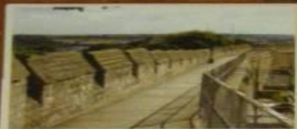
Галерея на стене для патрулирования