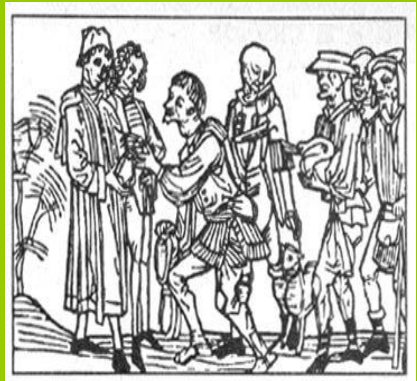
Крестьяне на оброке

За пользование землей зависимые крестьяне должны были нести повинности. Главными повинностями были барщина и оброк