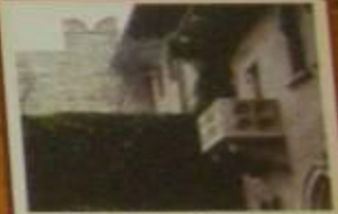
Верхний двор с домом хозяина