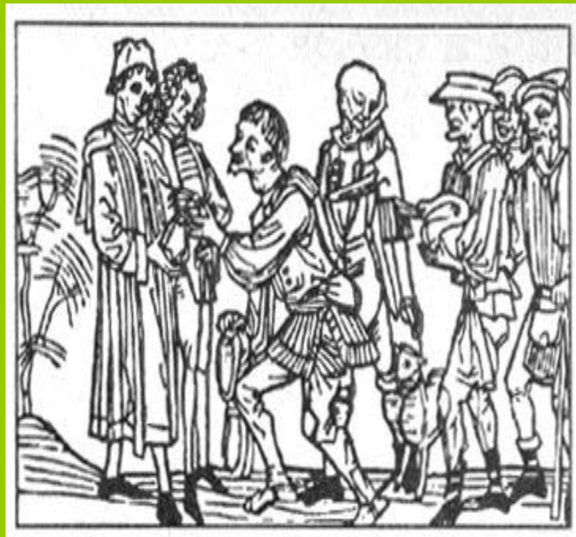
Крестьяне на оброке

За пользование землей зависимые крестьяне должны были нести повинности. Главными повинностями были барщина и оброк