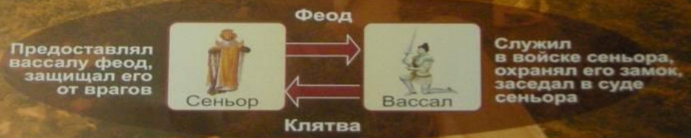
1. Вассальная пирамида VIII – XIV века

Вассал моего вассала – не мой вассал (Франция) Вассал моего вассала – мой вассал (Англия)