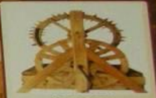
Колодец с механизмом