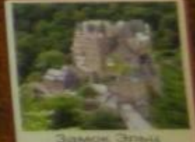
Замок Эльц 1157 г. Германия