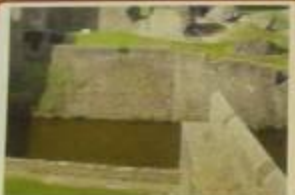
Ров с водой