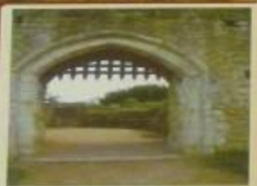
Ворота с решеткой