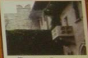
Верхний двор с домом хозяина