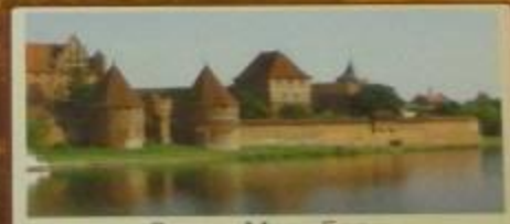
Замок Мальборк 1280 г. Польша