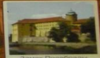
Замок Подебрады XII в. Чехия