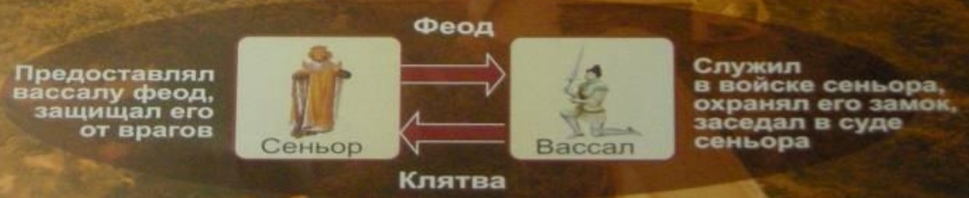
1. Вассальная пирамида VIII – XIV века

Вассал моего вассала – не мой вассал (Франция) Вассал моего вассала – мой вассал (Англия)