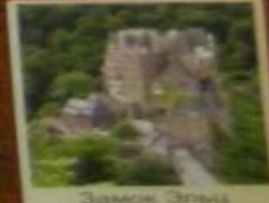
Замок Эльц 1157 г. Германия