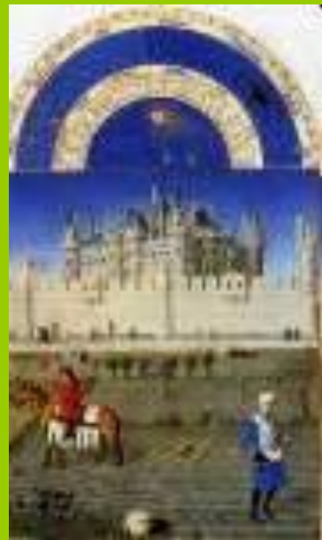
Календарь герцога Беррийского