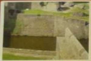
Ров с водой