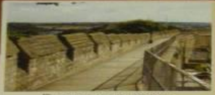
Галерея на стене для патрулирования