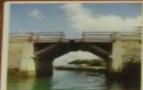
Подъемный мост через ров с водой