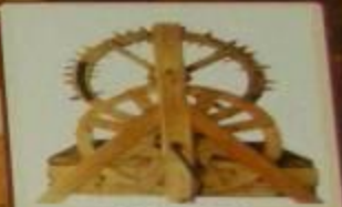
Колодец с механизмом