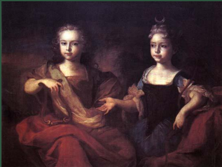
Царевич Петр Алексеевич с сестрой Натальей Алексеевной