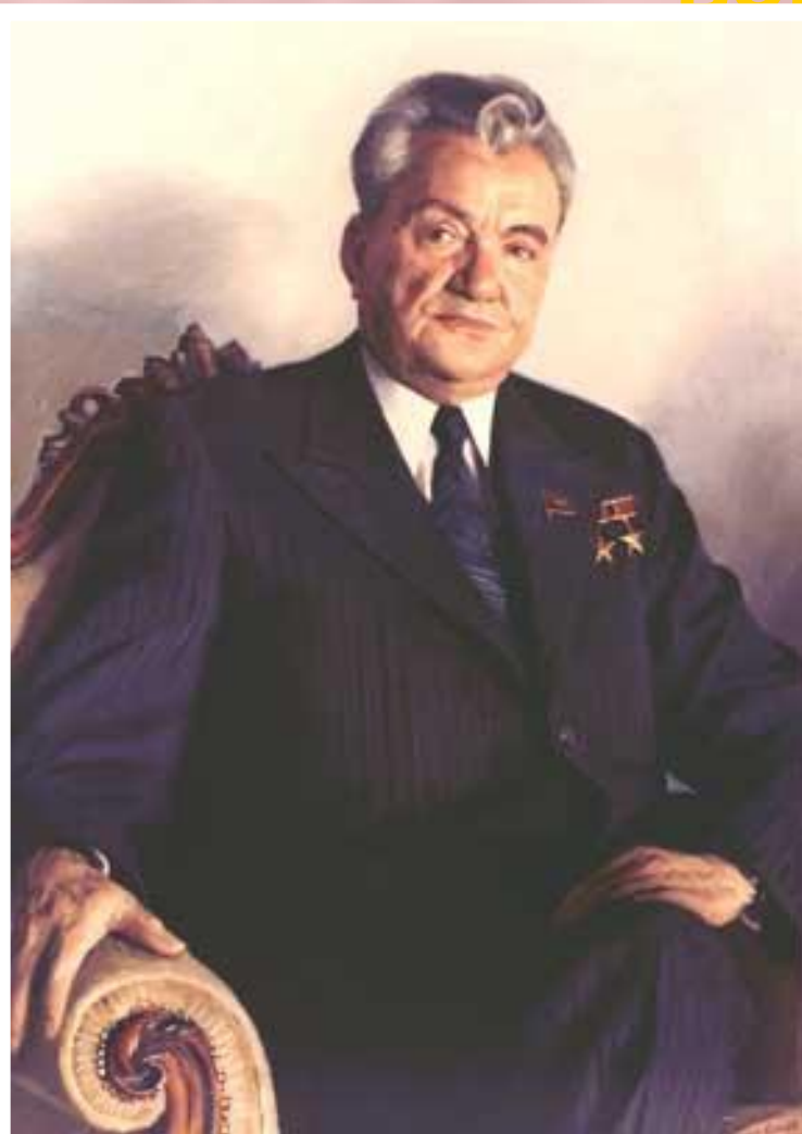
Д.А.Кунаев-1-й секретарь ЦК компартии Казахстана.

Демократизация общества привела к обострению межнациональных проблем. В н.1986 г.в Якутии студенты устроили демонстрацию под лозунгом «Якутия-для якутов». В декабре прошли массовые беспорядки в Казахстане вызванные заменой на посту 1 секретаря ЦК Д.Кунаева на Г.Колбина. Серьезное недовольство в Узбекистане вызвало расследование коррупции среди национального руководства. Наиболее остро национальный вопрос встал в Закавказье.