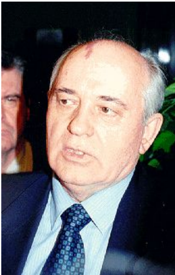
М.С. Горбачев после отставки. 25 декабря 1991 г.