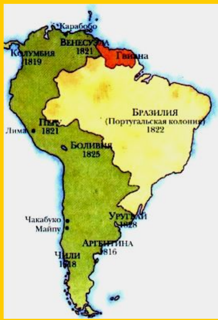
Латинская Америка в начале 19 в.

К н.19 в. Испания и Португалия владевшие почти всей Латинской Америкой ослабли и патриоты перешли к активным действиям.