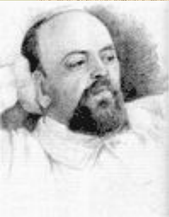
С. И. Мамонтов

1885 г. – частный оперный театр С. И. Мамонтова