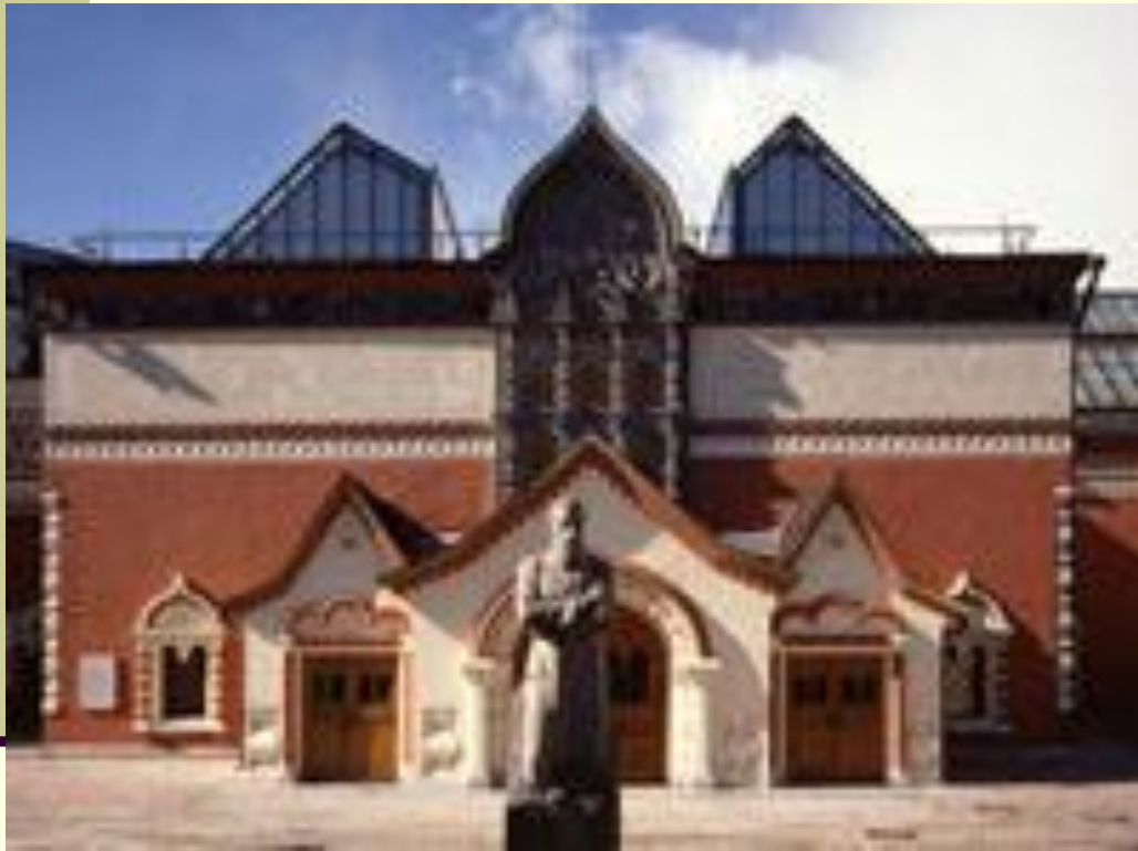
■ Третьяковская галерея