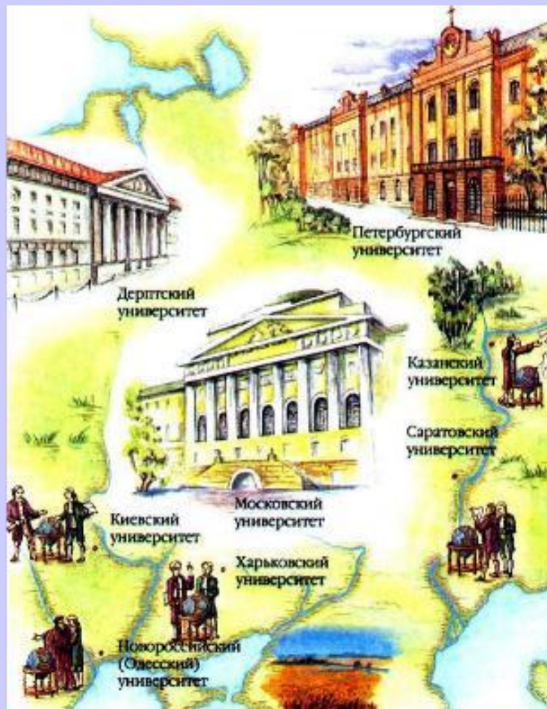
Университеты России в 19 веке.

После реформы 1803г. система образования состояла из 4-х ступеней: