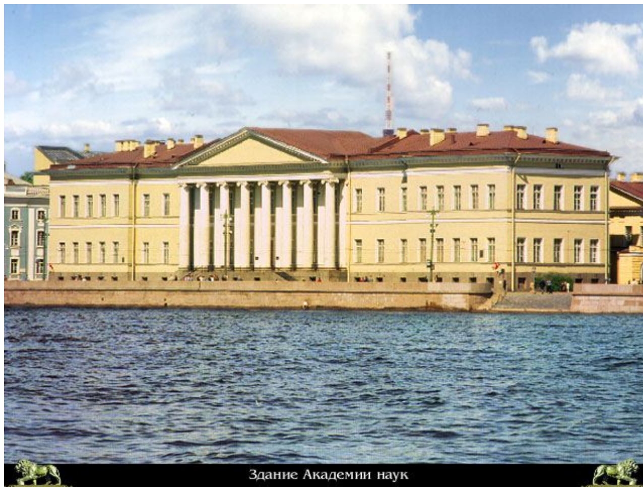
Здание Академии наук