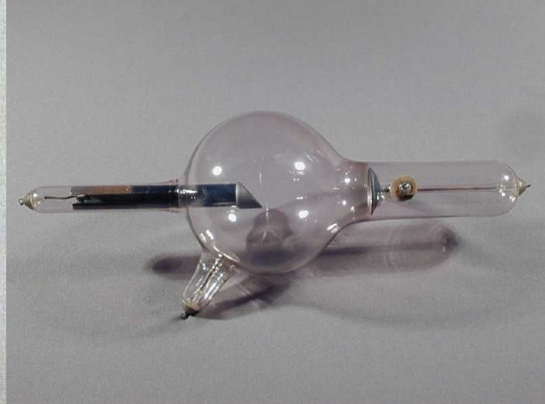
Одна из первых рентгеновских трубок