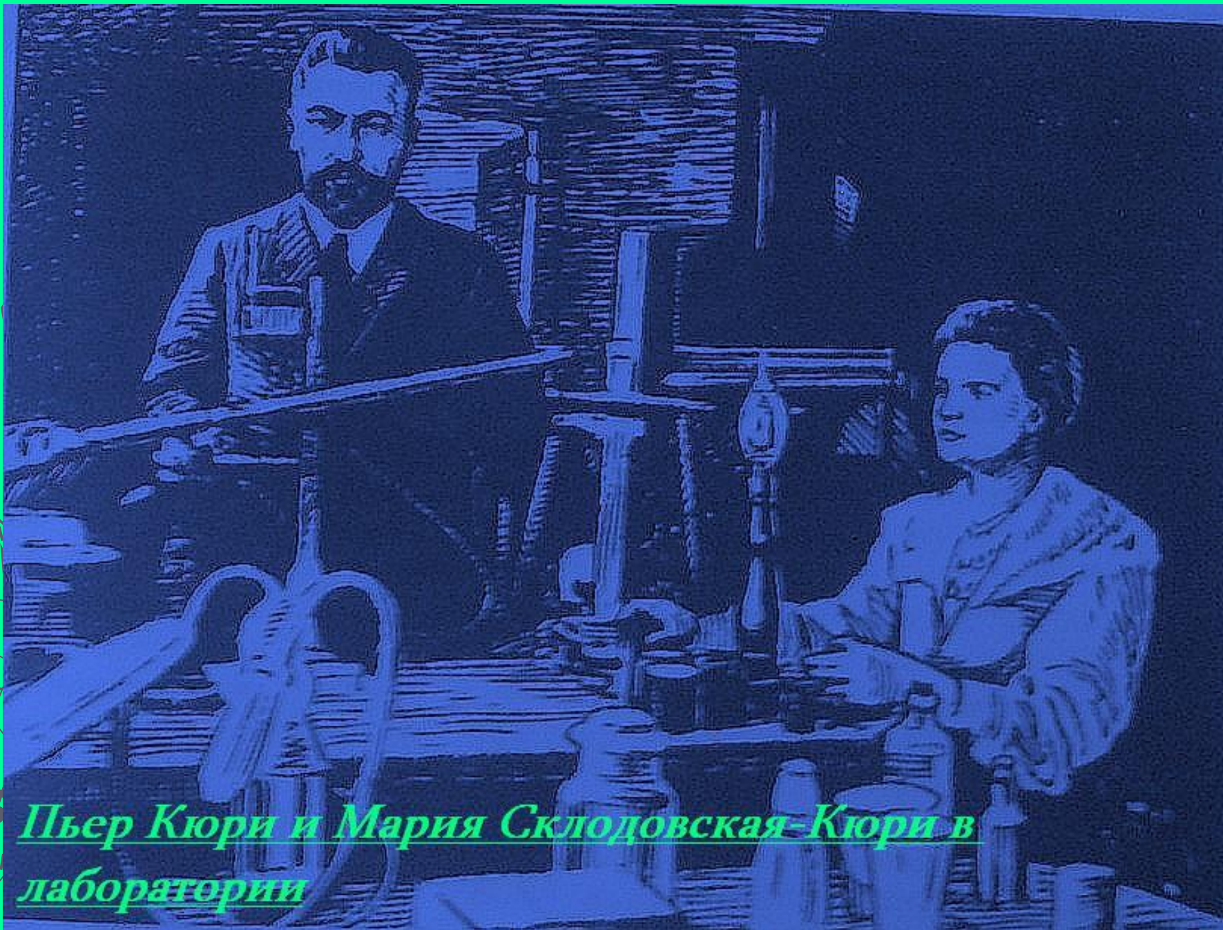
Пьер Кюри и Мария Склодовская-Кюри в лаборатории