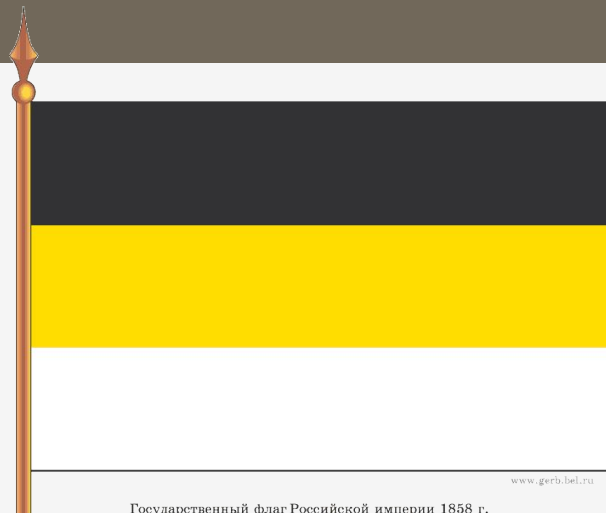
Государственный флаг Российской империи 1858 г.