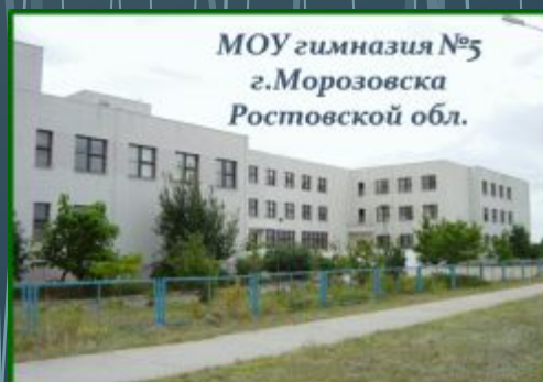
МОУ гимназия №5 г. Морозовска Ростовской обл.