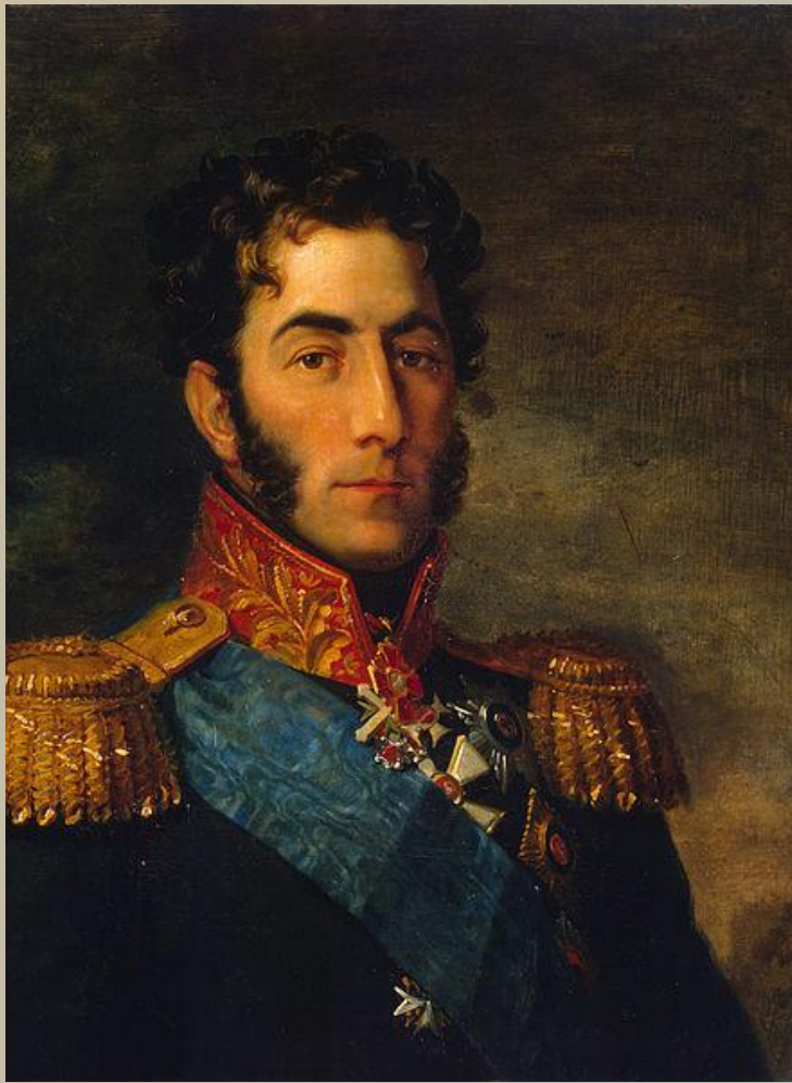
Князь Пётр Иванович Багратион (1765 —1812 г) российский генерал от инфантерии

Первые отвлекающие атаки французы произвели на правый фланг. Они оттеснили русские подразделения за реку Колочь.