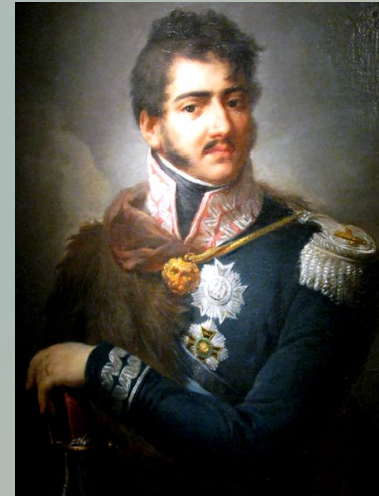
Юзеф Понятовский ; (7 мая 1763 — 19 октября 1813) — польский князь и генерал, маршал Франции, племянник короля Речи Посполитой Станислава Августа Понятовского