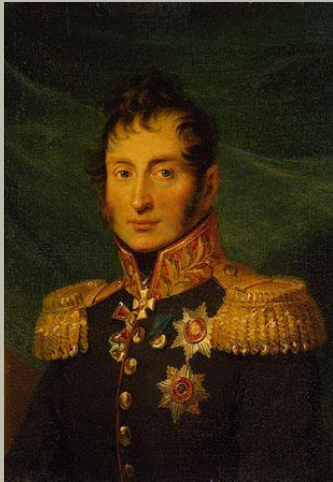
Николай Алексеевич Тучков — (1765—1812 гг.) генерал-лейтенант российской армии, командир пехотного корпуса.

Почти одновременно для выхода в тыл Семеновским флешам польский корпус генерала Ю. Понятовского попытался прорваться к деревне Утица, где вступил во встречный бой с корпусом под командованием генерала Н.А. Тучкова.