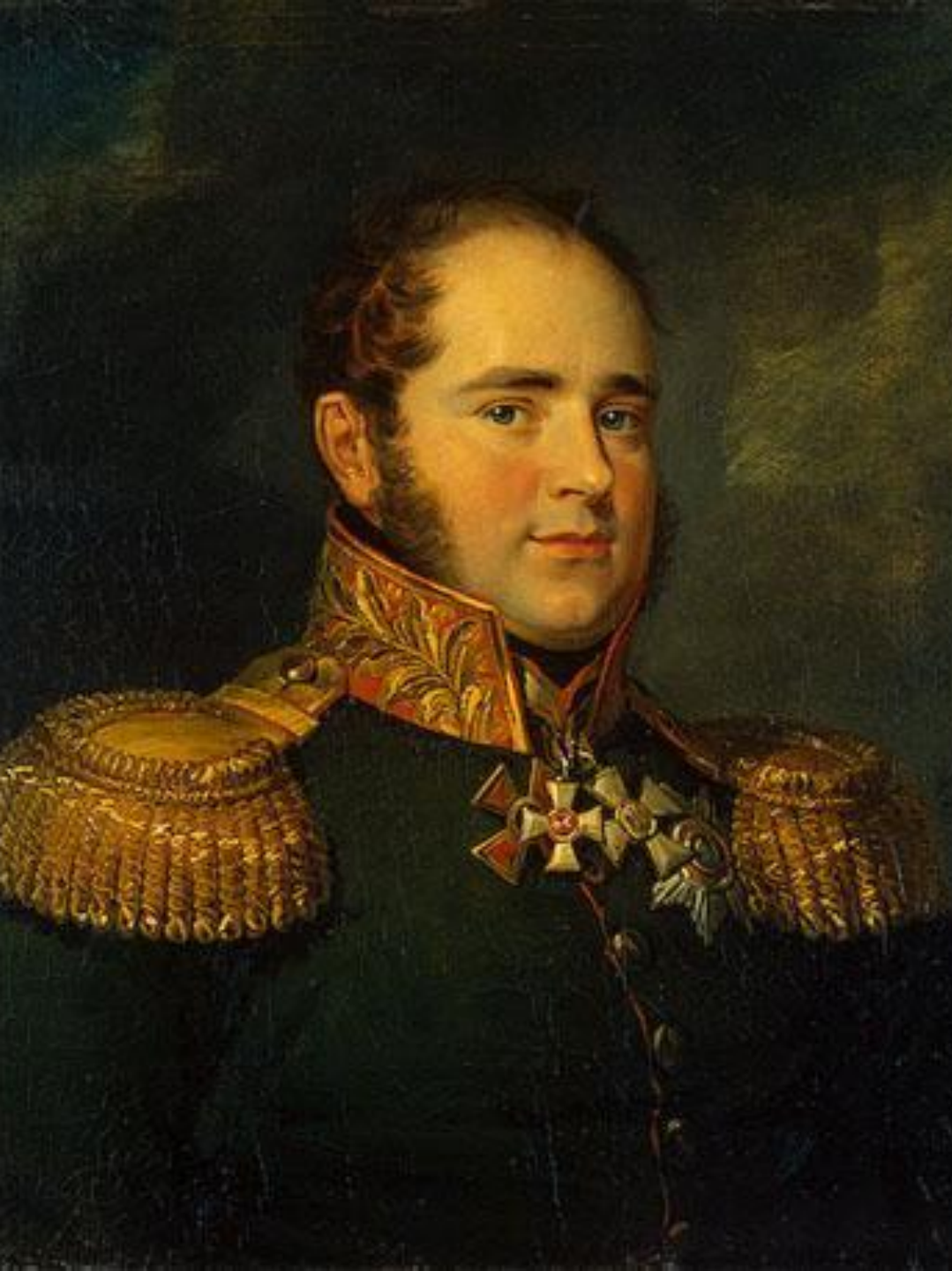
• Карл Фёдорович Багговут (1761—1812), российский генерал-лейтенант.