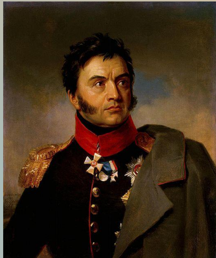
Николай Николаевич Раевский (1771—1829) русский полководец, генерал от кавалерии.

В 14 часов французы главный удар перенесли на батарею Раевского, которая после падения Багратионовских флешей стала открыта уже не только для фронтального, но и для флангового удара. Наполеон сосредоточил против нее огонь около 300 орудий). После третьей отчаянной атаки им удалось к 17 часам ворваться на высоту.