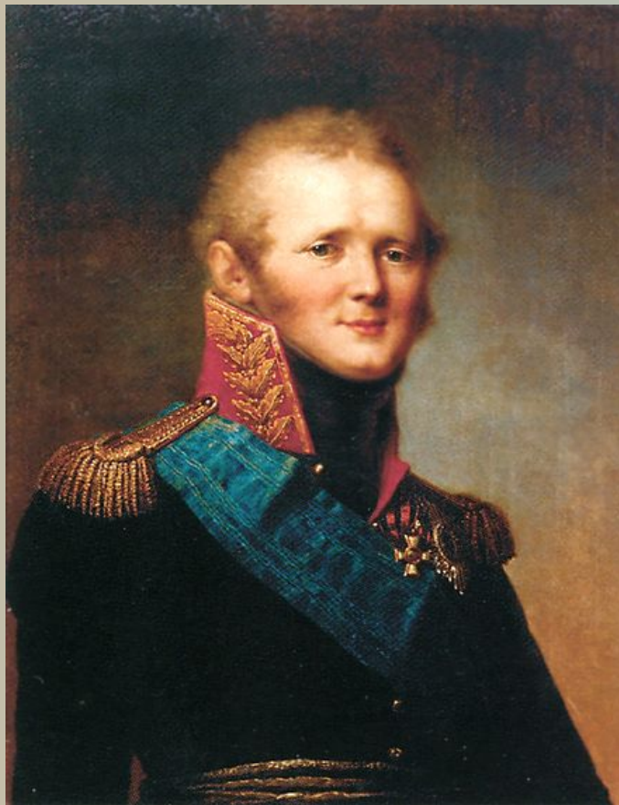
Александр I Павлович Благословенный— Государь император и самодержец Всероссийский

О результатах Бородинского сражения Кутузов доносил Александр I :