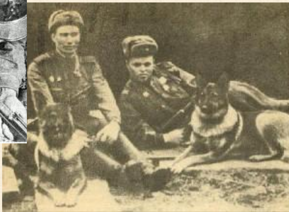
Справа знаменитая собака Дина