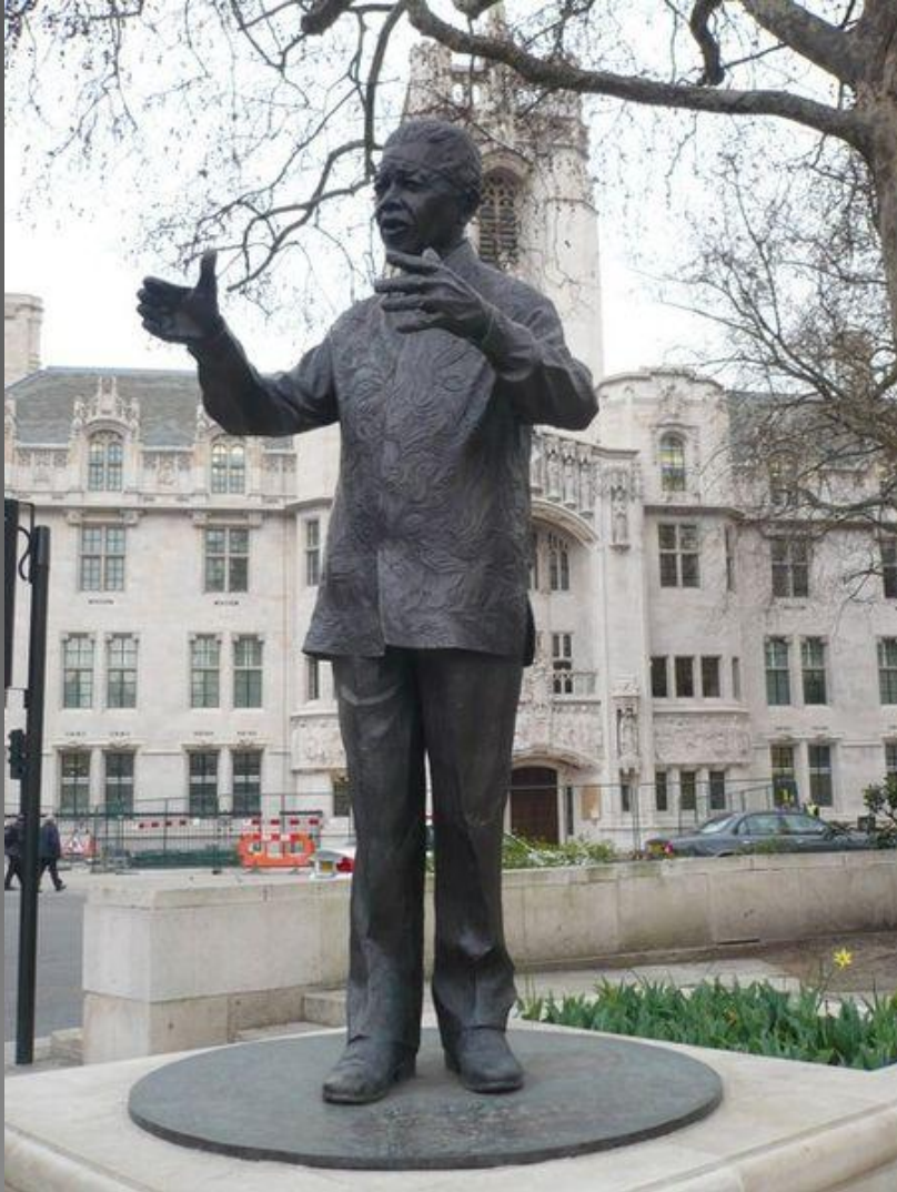
Памятник Нельсону Манделе в Лондоне