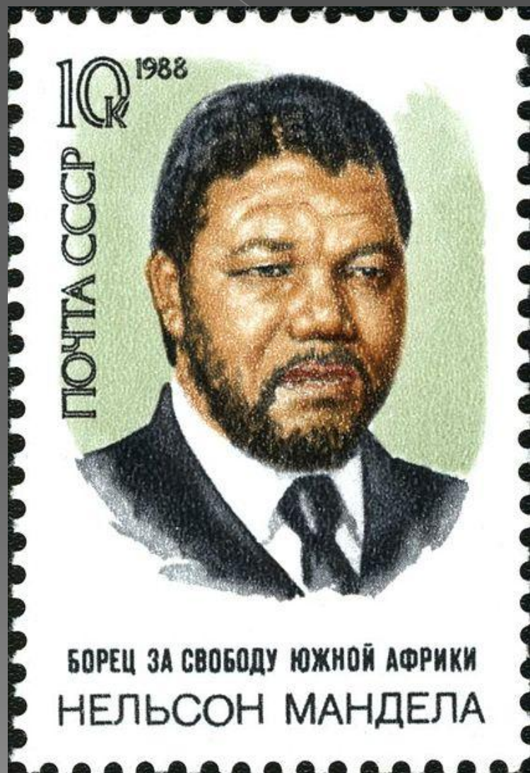
ПОЧТОВАЯ МАРКА СССР, 1988ГОД.