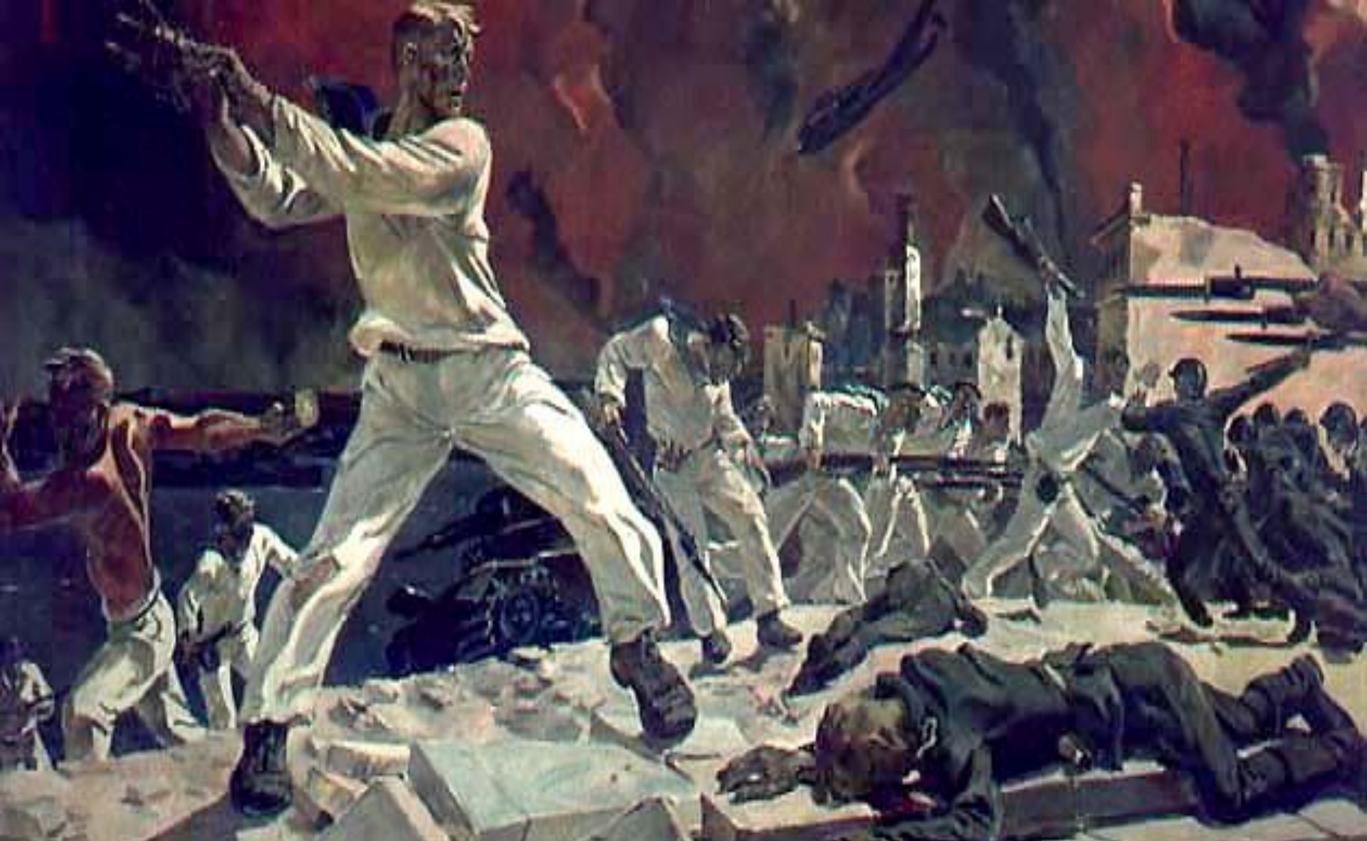
А. А. Дейнека. «Оборона Севастополя». 1942..