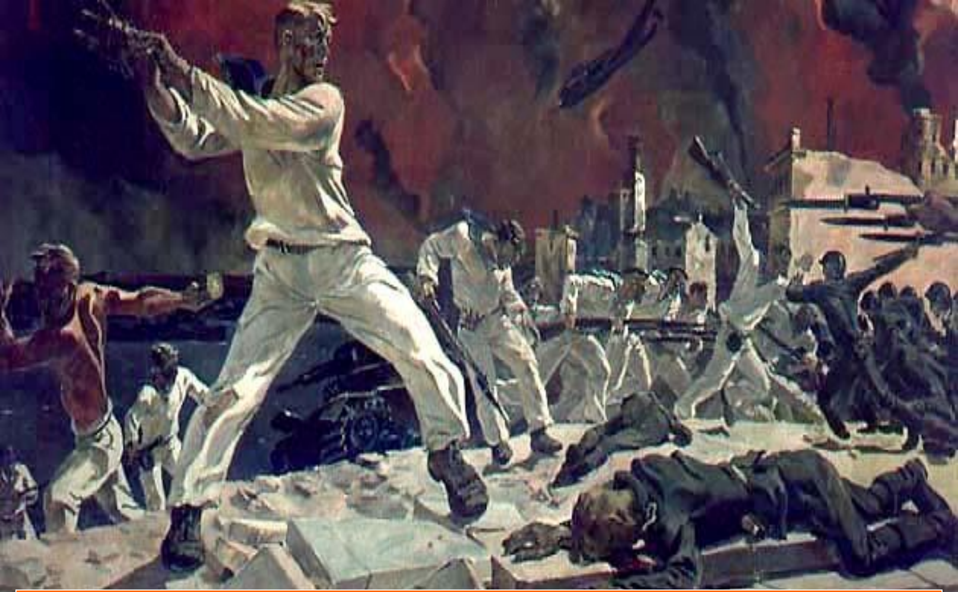
А. А. Дейнека. «Оборона Севастополя». 1942..