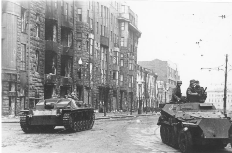
Oktober 1941

В мае советские войска перешли в наступление в районе Харькова, но потерпели жестокое поражение: были окружены и уничтожены войска двух советских армий.