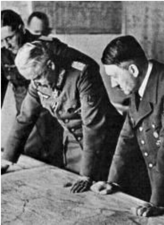
Гитлер и Манштейн у карты

Гитлер считал стратегической целью предстоящей кампании широкомасштабное наступление на южном направлении с целью овладеть Нижней Волгой и Кавказом.