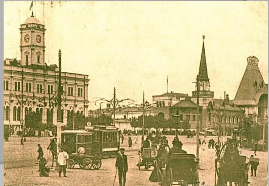
Москва 20-х годов.