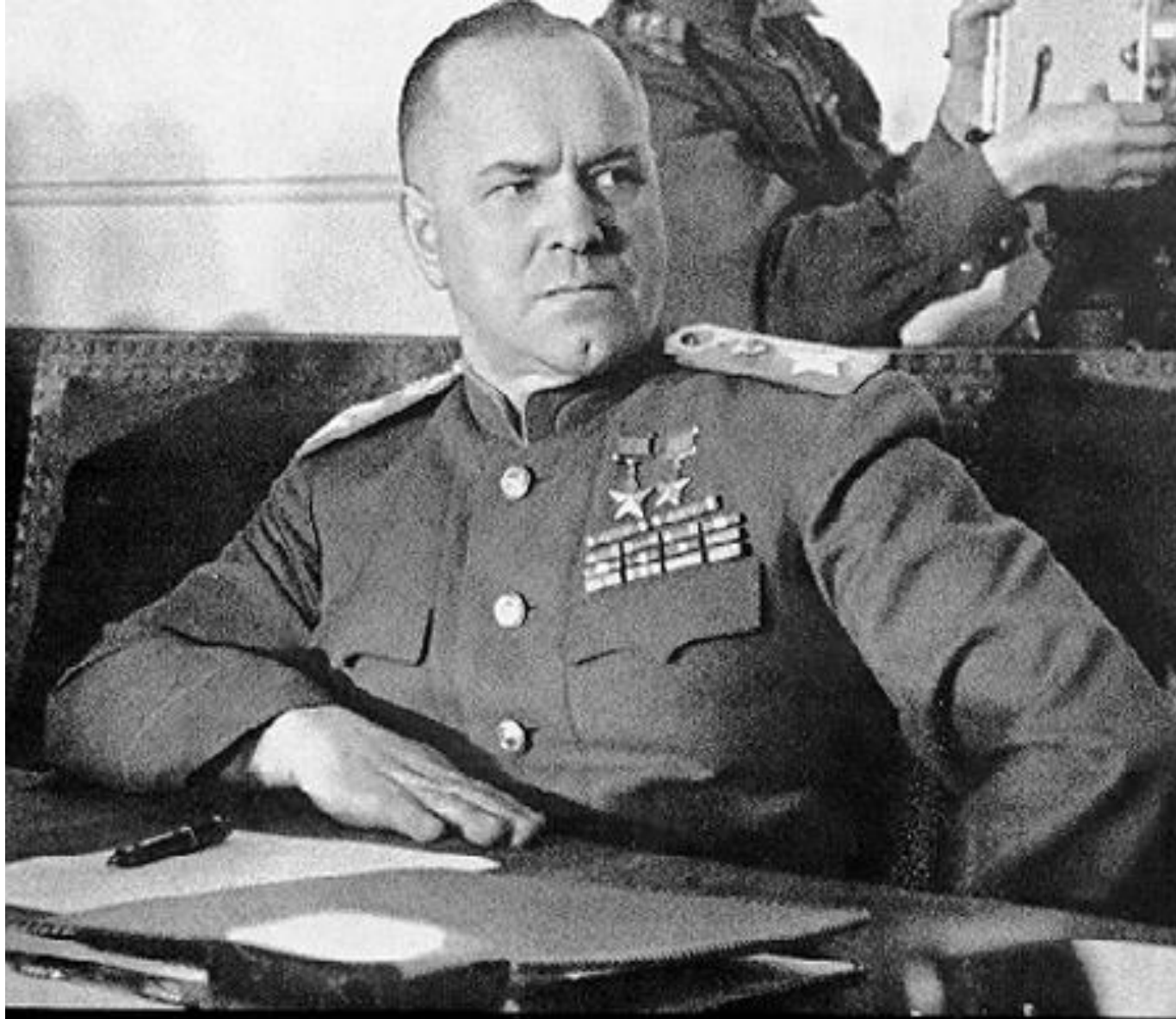
Г. К. Жуков