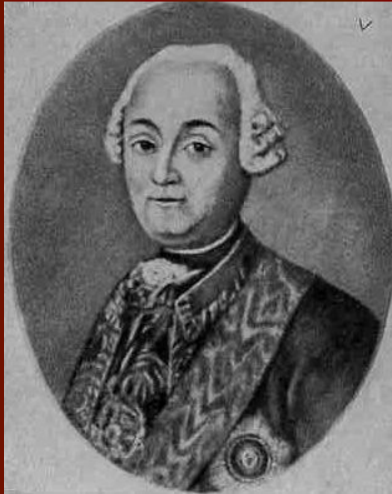
Василий Иванович Суворов, отец А.В.Суворова