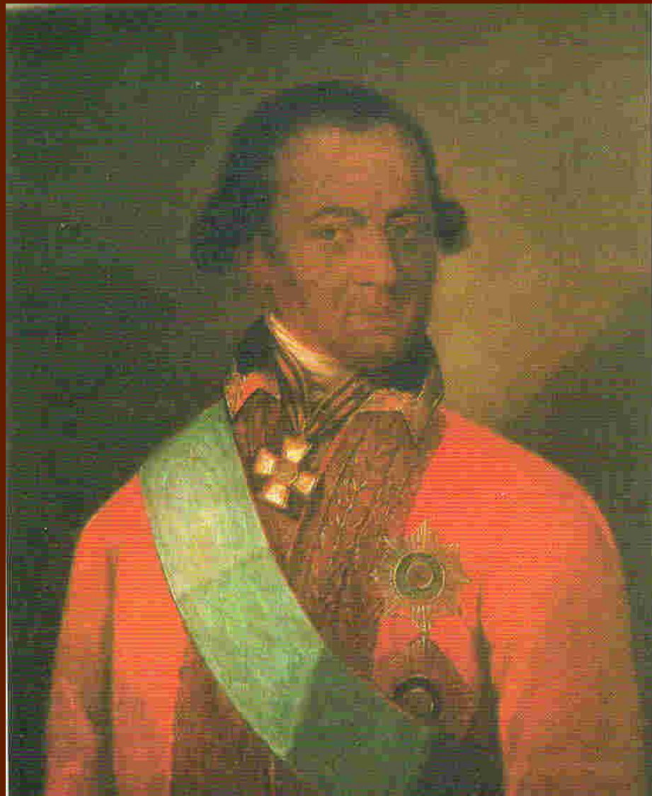
Абрам Петрович Ганнибал