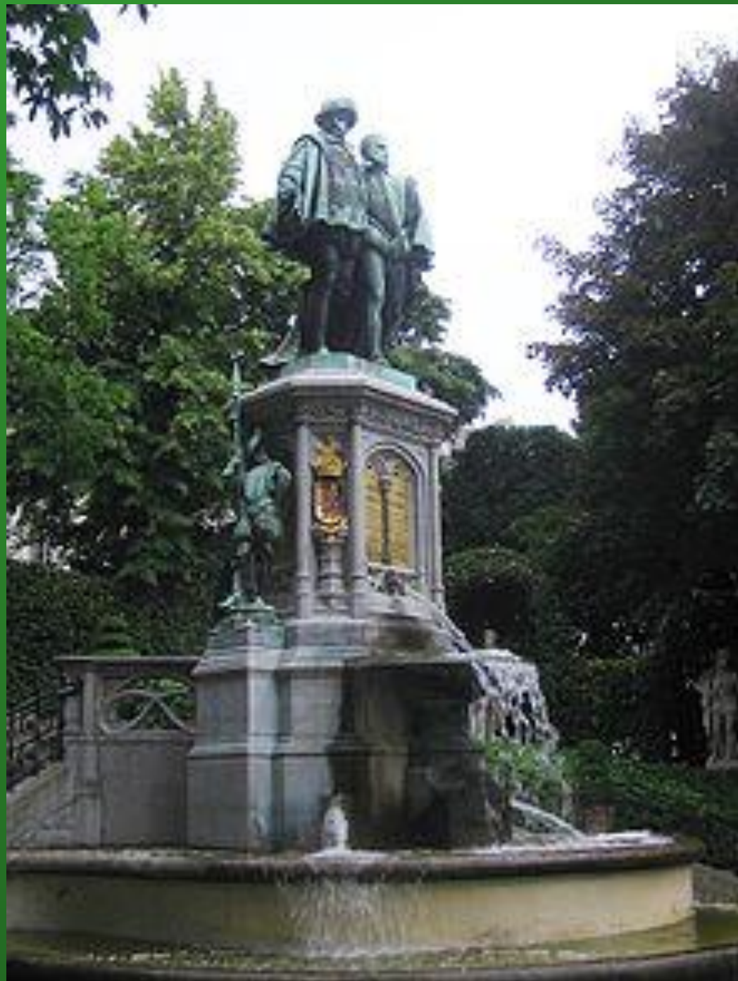
Памятник Эгмонту и Горну