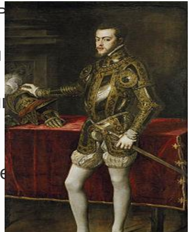
Филипп II в парадных доспехах