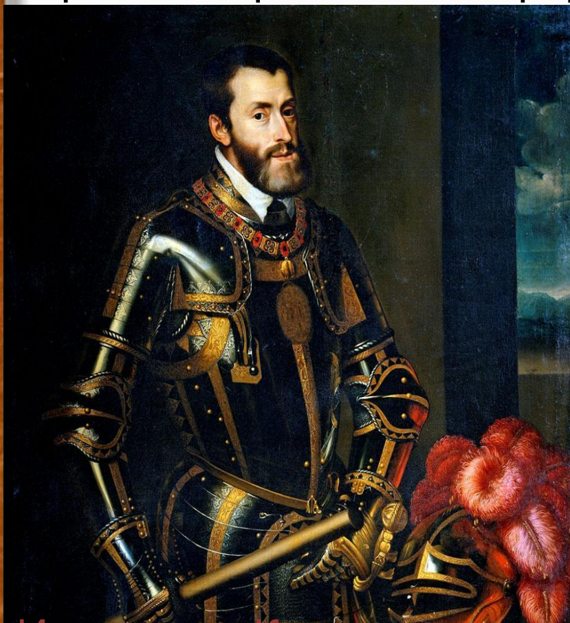
Император Карл V с

Недовольство налогами и религиозными преследованиями усиливалось, но при Карле V редко перерастало в открытое неповиновение: в то время Нидерланды имели широкие возможности для торговли в Европе и в Новом Свете