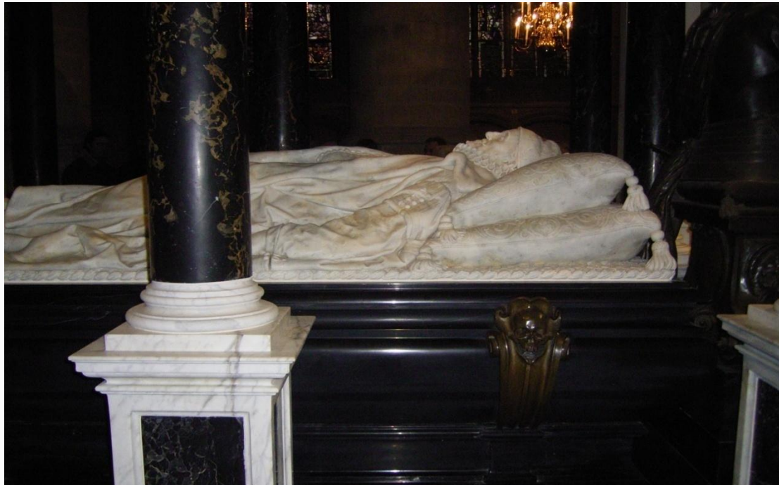
Нагробие Вильгельма Оранского

В 1584 г. неистово верующий католик Жерар застрелил Вильгельма Оранского. За это он был четвертован протестантами, а католиками причислен к лику мучеников. В 1587—1609 гг. республика в союзе с Англией и Францией продолжала вести войну против Испании.