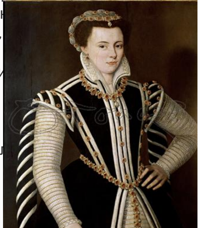
Наместник Нидерландов Маргарита Пармская

Вскоре выяснилось, что восставшие требуют не только религиозной реформы, но и раздела имущества богачей. Это отпугнуло от движения наиболее состоятельных людей, что позволило Маргарите Пармской некоторыми уступками расколоть силы восставших, собрать войска и к весне 1567 г. подавить восстание. Несмотря на это, в Испании спешно готовил карательную армию.