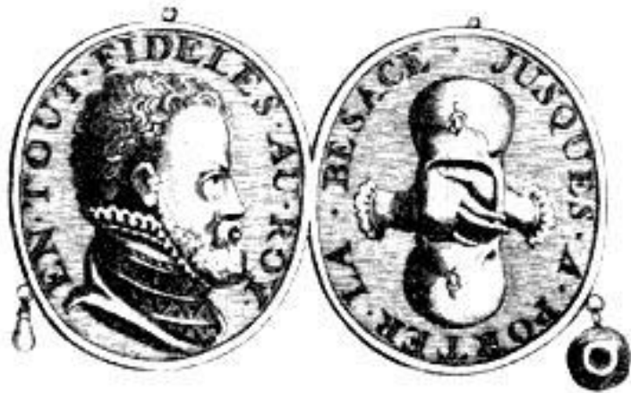
Медаль дворянских гёзов.

Гёзы - борцы против гнёта испанцев, получившие прозвище из-за скромной одежды. На суше действовали лесные гёзы, на море - морские. И те, и другие наносили тяжёлый урон испанским войскам.