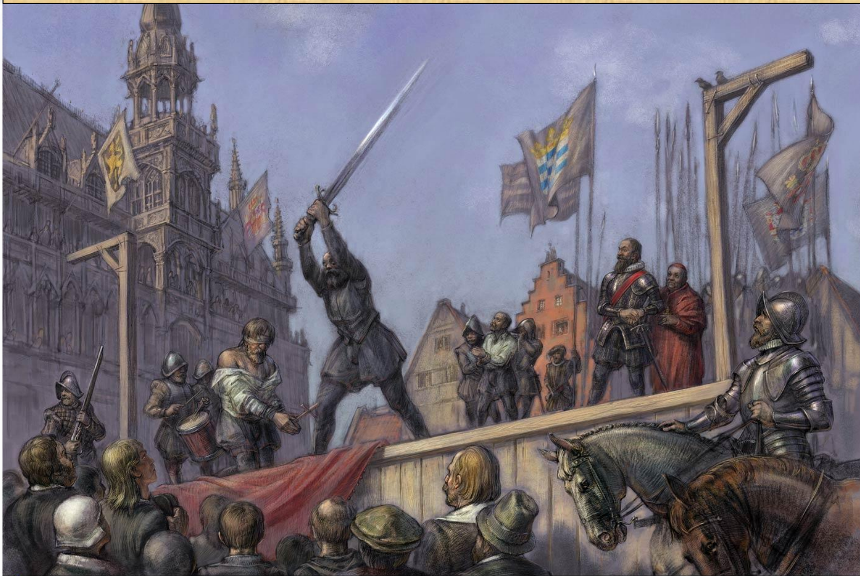
Казнь Эгмонта и Горна.