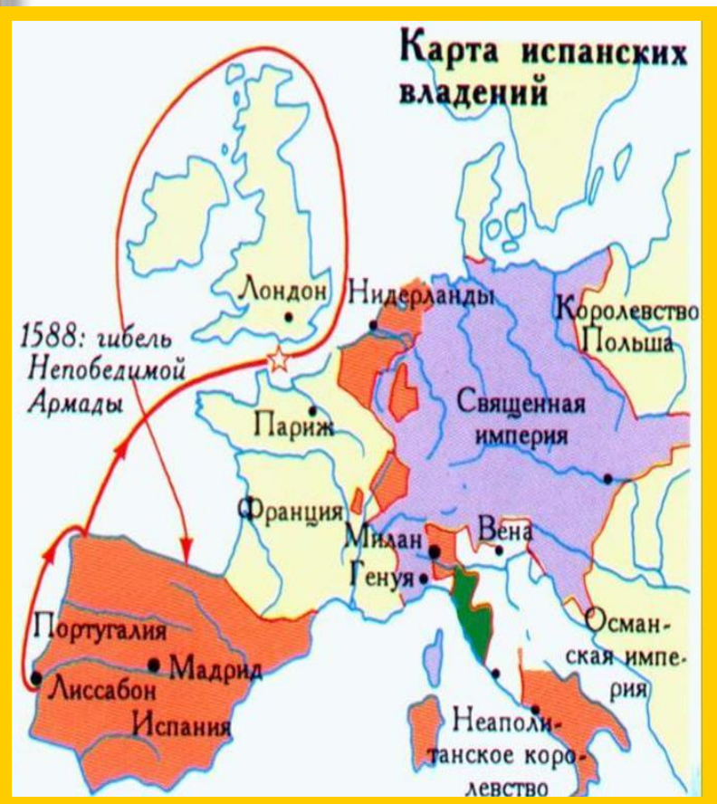
Карта испанских владений.

выгодным. По рекам жители Нидерландов торговали с Францией и Германией, а по морю – с Англией и странами Балтии. Эта страна считалась одной из самых богатых в Европе. На её небольшой территории к XVI в. имелось около 300 городов и более 6500 деревень.