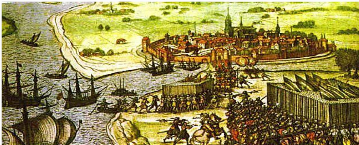
Взятие Бриля морскими гезами

В 1572 г. война уже приняла открытую форму. Лидером повстанцев принц Вильгельм Оранский. В 1572 г. порт Бриль был захвачен морскими гезами. Это стало сигналом для восстания во всех Нидерландах. Летом 1572 г. Вильгельм Оранский был провозглашен Генеральными Штатами правителем Голландии и Зеландии. Южные провинции признали власть Филиппа II .