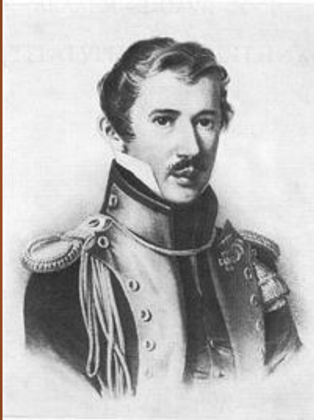
М. С. Луни н

В 1816 году принял активное участие в создании Союза спасения. Один из основателей Союза благоденствия (1818). Вместе с С. Трубецким и А. Н. Муравьёвым участвовал в создании устава Союза благоденствия — «Зелёной книги». В январе 1820 года на Петербургском совещании Союза высказался за установление республиканского правления путём военного восстания. Выходит в отставку в начале 1820 года. Уезжает на юг России вместе с М. С. Луниным и встречается там с Пестелем. После формального роспуска Союза благоденствия (1821 год) Муравьёв инициирует создание новой организации — Северного общества, его влияние в 1821—1823 г.г. в обществе было чрезвычайно велико