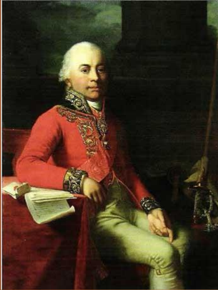
Михаил Никитич Муравьёв

Михаил Никитич Муравьёв (19.07.1796 — 10.04.1843 с. Урик Иркутской губ.) — один из главных идеологов движения декабристов. Сын писателя и публициста Михаила Никитича Муравьёва и Екатерины Фёдоровны (урождённой баронессы Колокольцевой). Получил отличное домашнее образование. Позднее поступил на физико-математическое отделение Московского университета. С февраля 1812 года — коллежский регистратор в Департаменте Министерства юстиции. В начале войны 1812 года убежал из дома в действующую армию. Официально зачислен в армию прапорщиком свиты по квартирмейской части в июле 1813 года.