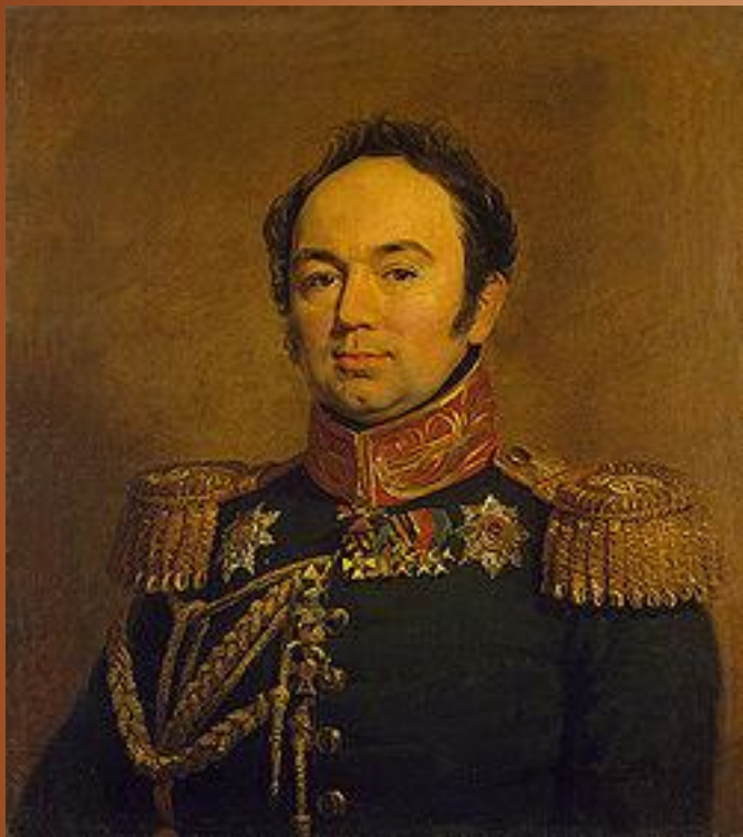
А. А. Закревский