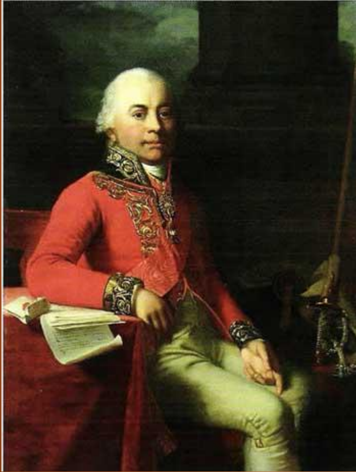
Михаил Никитич Муравьев

Михаил Никитич Муравьев (19.07.1796 — 10.04.1843 с. Урик Иркутской губ.) — один из главных идеологов движения декабристов. Сын писателя и публициста Михаила Никитича Муравьева и Екатерины Фёдоровны (урождённой баронессы Колокольцевой). Получил отличное домашнее образование. Позднее поступил на физико-математическое отделение Московского университета. С февраля 1812 года — коллежский регистратор в Департаменте Министерства юстиции. В начале войны 1812 года убежал из дома в действующую армию. Официально зачислен в армию прапорщиком свиты по квартирмейской части в июле 1813 года.