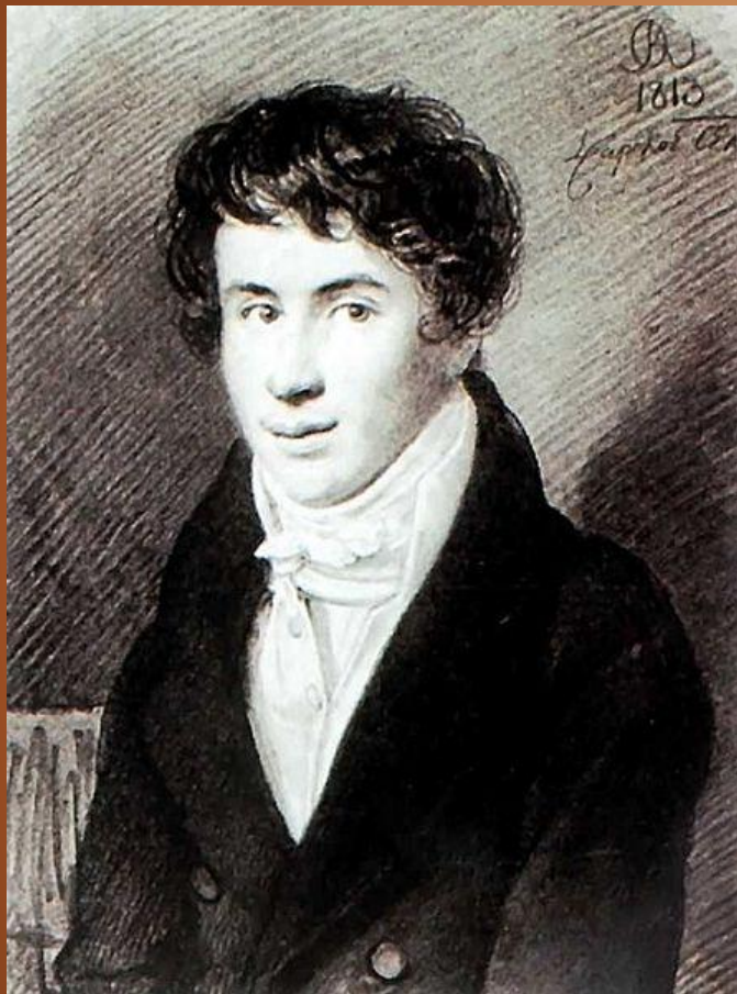
Никита Михайлович Муравьёв

Осужденный I разряду. По конфирмации 10 июля 1826 года приговорён к каторжным работам сроком на 20 лет, 22 августа 1826 года срок каторги сокращён до 15 лет. Отправлен в Сибирь 10 декабря 1826 года. Отбывал наказание с 28 января 1827 года в Читинском остроге, с сентября 1830 года — в Петровском заводе. В Петровском заводе читал курс лекций по истории России и военной истории. Активный участник Малой артели. В ноябре 1832 года срок был сокращён до 10 лет. Из Петровского завода отбыл на поселение в с.Урик Иркутского округа. На поселении вместе с братом занимался сельским хозяйством. Построил мельницу. Есть сведения, что в Сибири Муравьёв писал политические сочинения и мемуары, но после ареста Лунина в 1841 году всё уничтожил.