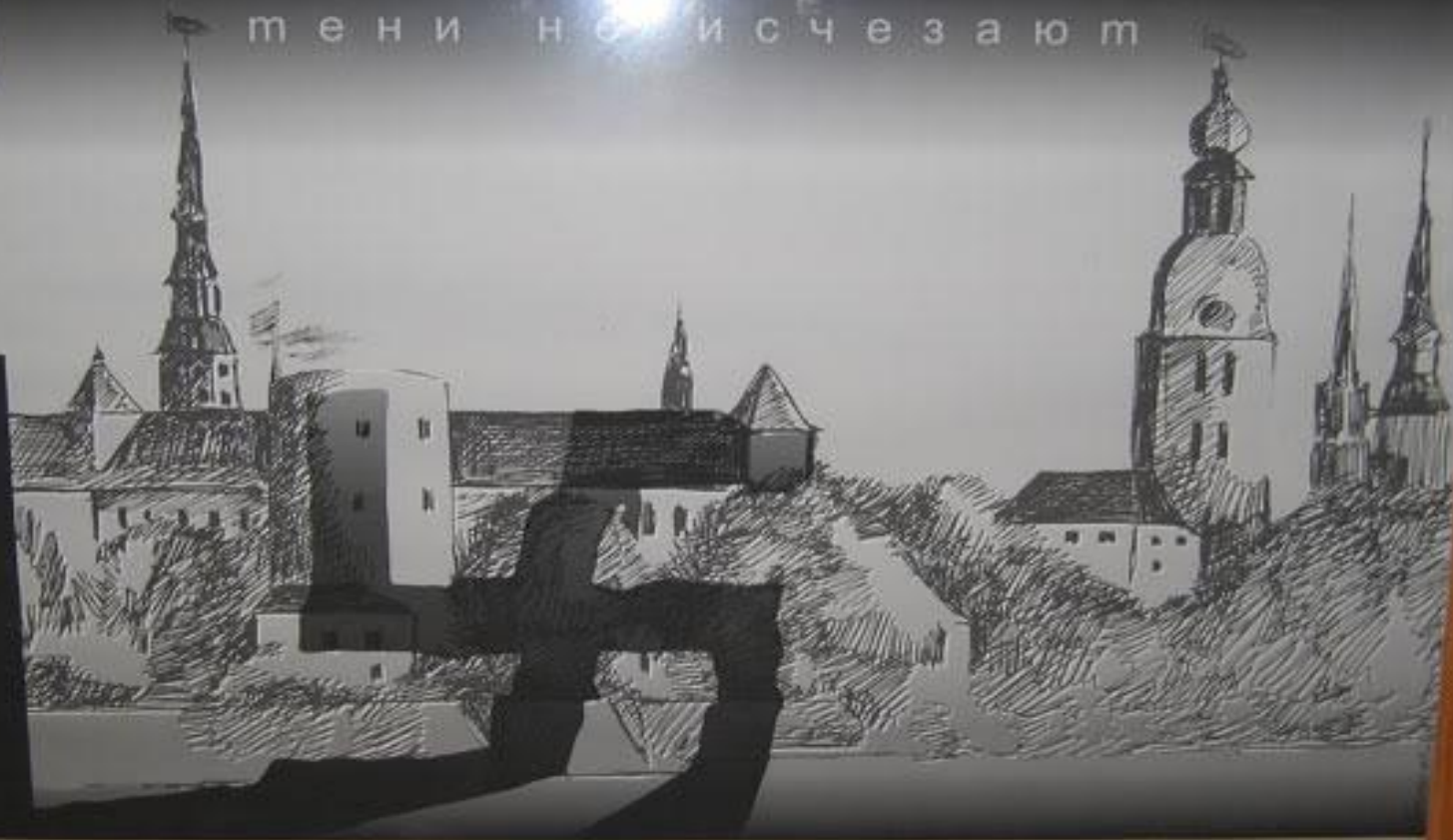
© 2014 BY JARVIS ALL RIGHTS RESERVED 100% COTTON