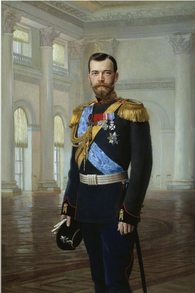
Портрет императора Николая II работы Эрнста Липгарта. 1896.