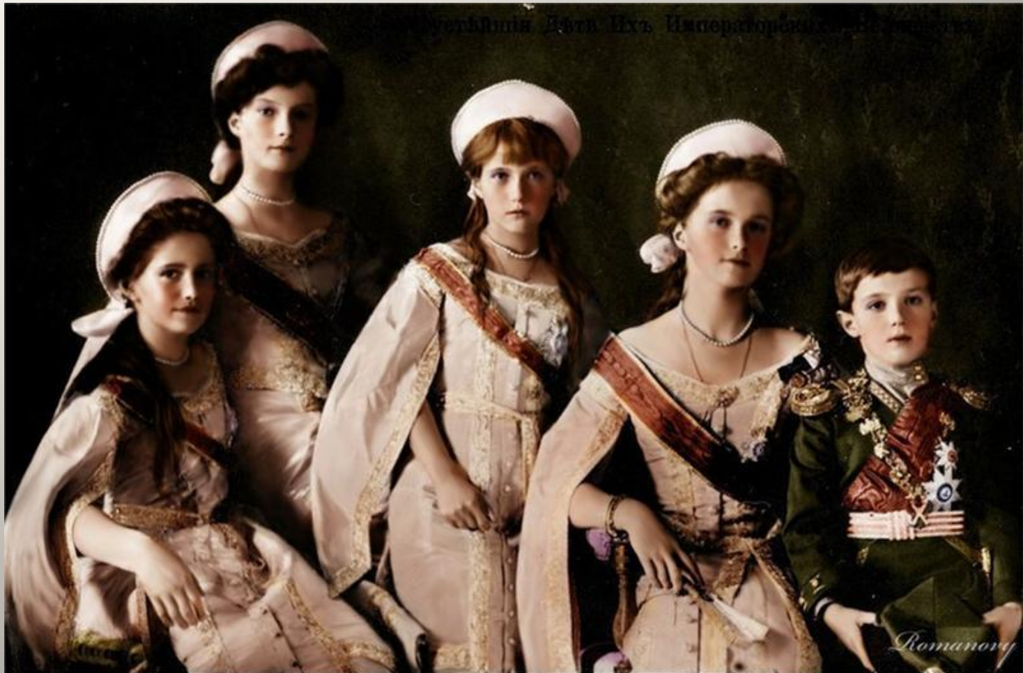
Сестры Императорского Дома Романовых