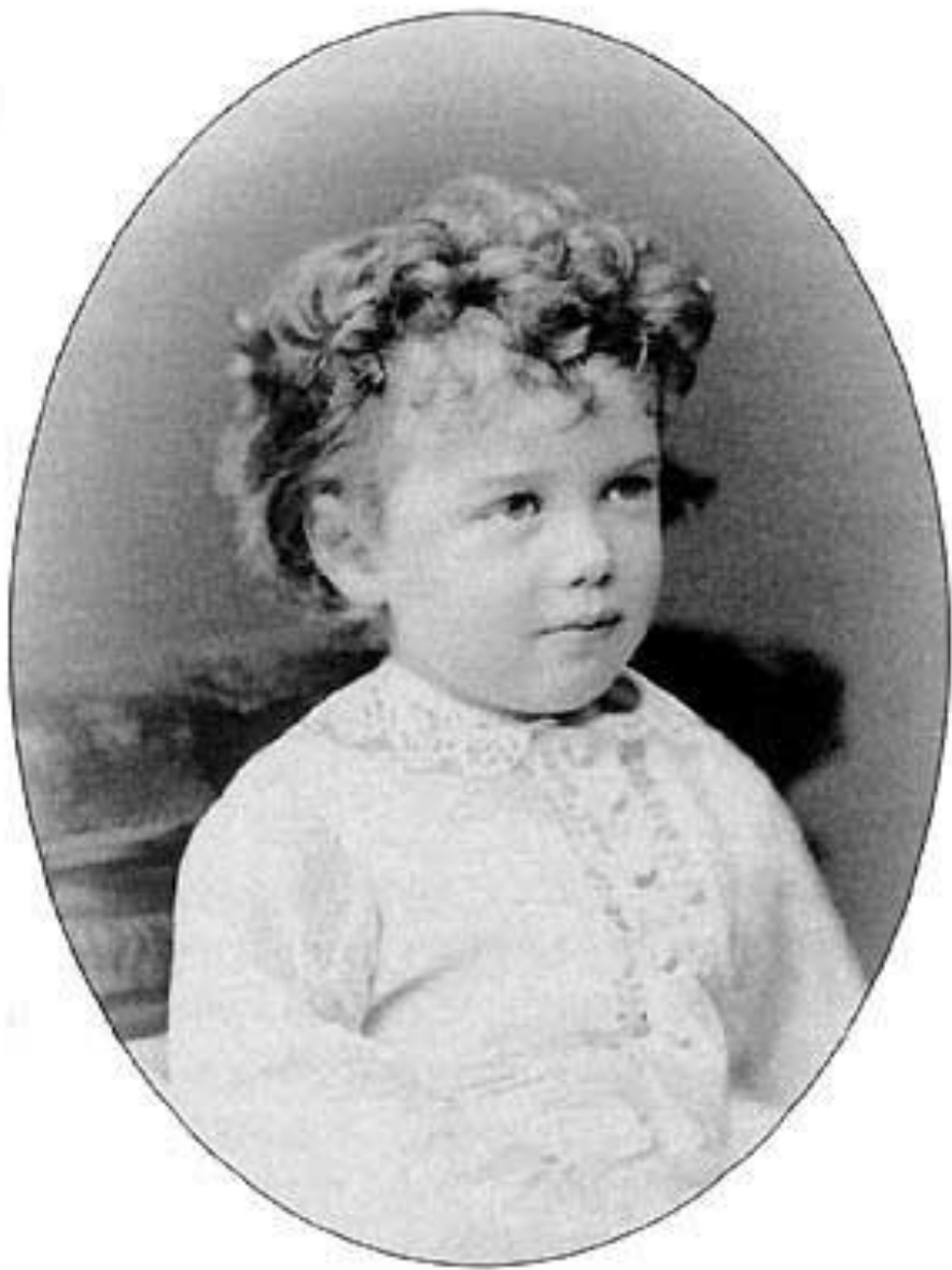
Цесаревич Николай Александрович в возрасте трех лет