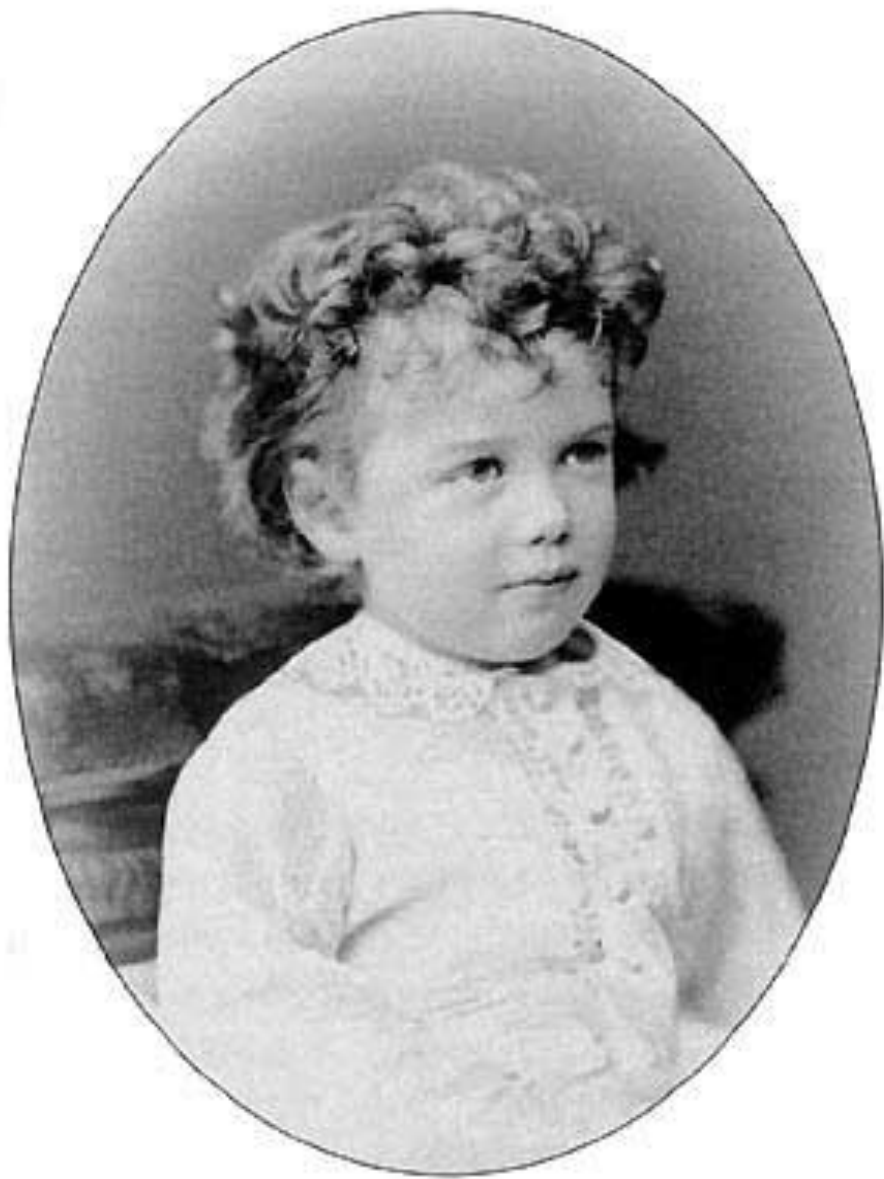
Цесаревич Николай Александрович в возрасте трех лет