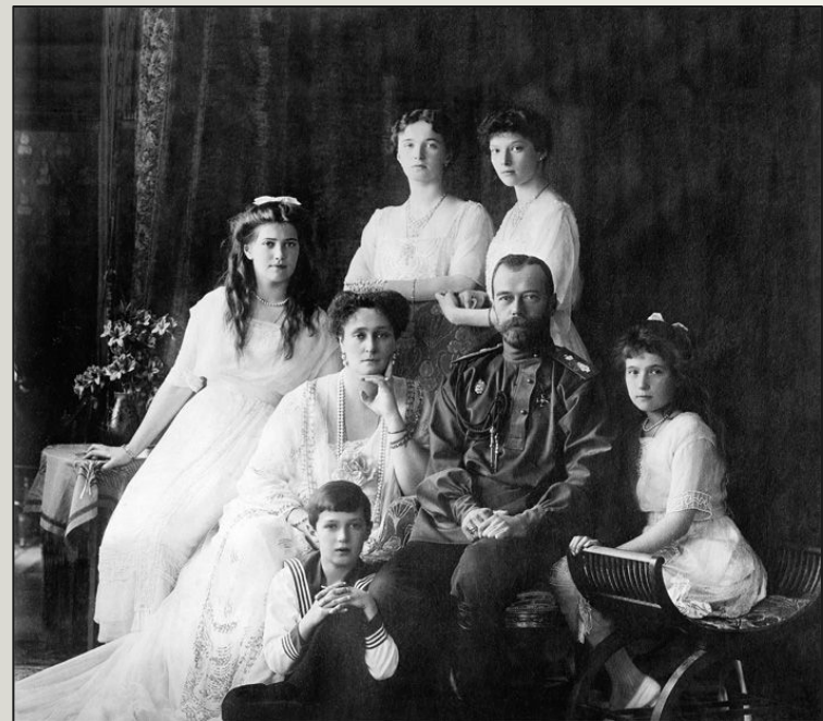
Семья Николая II: Александра Федоровна и дети — Ольга, Татьяна, Мария, Анастасия и Алексей. 1913 г.