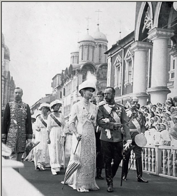
Семья Николая II во время празднования трехсотлетия дома Романовых. 1913 г.

Опорой Николая II была семья. Императрица Александра Федоровна (урожденная принцесса Алиса Гессен-Дармштадтская) была для царя не только женой, но и другом, советчиком. Привычки, представления и культурные интересы супругов во многом совпадали. Они обвенчались 14 ноября 1894. У них было пятеро детей: Ольга (1895-1918), Татьяна (1897-1918), Мария (1899-1918), Анастасия (1901-1918), Алексей (1904-1918).