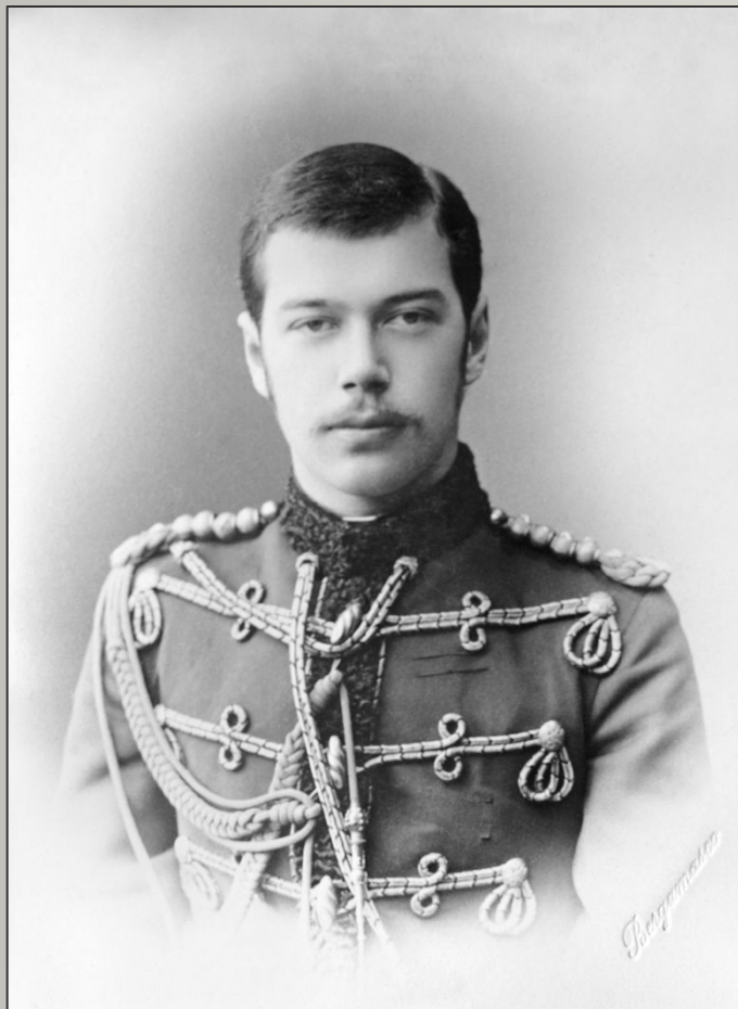
Николай Александрович, 1889 год

Николай Александрович Романов родился (6) 18 мая 1868 года в Царском селе. Он был старшим сыном императора Александра III и императрицы Марии Федоровны. По традиции Николай получил домашнее образование, соответствующее курсу гимназии. С ранних лет Николай испытывал тягу к военному делу. Сразу же после рождения он был зачислен в списки нескольких гвардейских полков и назначен шефом 65-го пехотного московского полка. В декабре 1875 получил свое первое воинское звание — прапорщика, а в 1880 был произведен в подпоручики, через 4 года стал поручиком. В 1884 Николай II поступил на действительную военную службу, в июле 1887 приступил к регулярной военной службе в Преображенском полку и был произведен в штабс-капитаны, в 1891 Николай получил звание капитана, а через год — полковника.