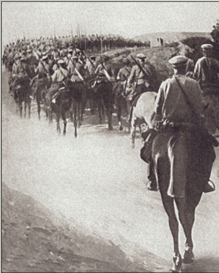
Русские войска на марше, 1915 год

Переломным рубежом в судьбе Николая II стал 1914 год — начало Первой мировой войны. Царь не хотел войны и до самого последнего момента пытался избежать кровавого столкновения. Однако 19 июля (1 августа) 1914 Германия объявила войну России.