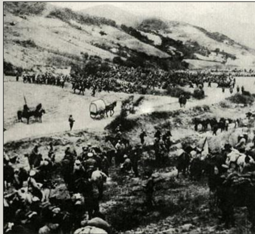
Передвижение войск. Карл Булла

Русско-японская война 1904-1905 гг. велась за господство в Северо-Восточном Китае и Корее. Война была начата Японией. В 1904 году японский флот напал на Порт-Артур, оборона которого продолжалась до начала 1905 года. Россия потерпела поражения на реке Ялу, под Ляояном, на реке Шахэ. В 1905 году японцы разгромили русскую армию в генеральном сражении при Мукдене, а русский флот - при Цусиме. Война закончилась Портсмутским миром 1905 года, по условиям которого Россия признала Корею сферой влияния Японии, уступила Японии Южный Сахалин и права на Ляодунский полуостров с городами Порт-Артуром и Дальним. Поражение русской армии в войне ускорило начало революции 1905-1907 гг.