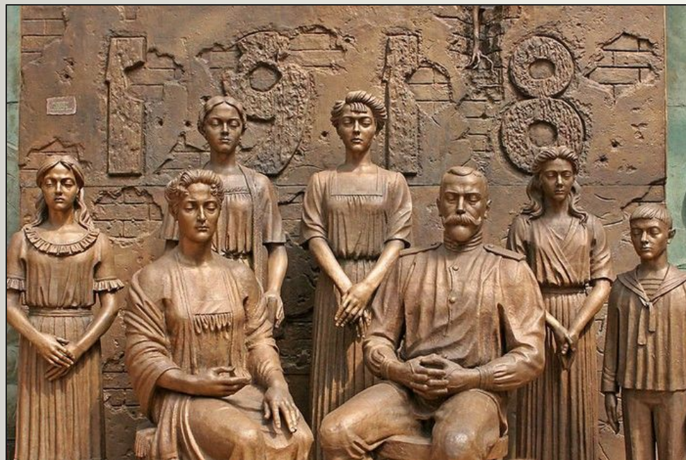
З.К. Церетели. «Ипатьевская ночь». 2007 Скульптурная композиция, посвященная расстрелу царской семьи

9 марта Николай II и царская семья были арестованы. Первые пять месяцев они находились под охраной в Царском Селе, в августе 1917 их переправили в Тобольск. В апреле 1918 большевики перевели Романовых в Екатеринбург. В ночь на 17 июля 1918 в центре Екатеринбурга, в подвале дома Ипатьева, где узники находились в заточении, Николай, царица, пятеро их детей и несколько приближенных (всего 11 человек) были без суда и следствия расстреляны.