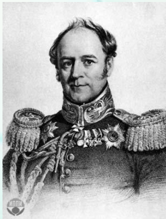
Александр Христофорович Бенкендорф