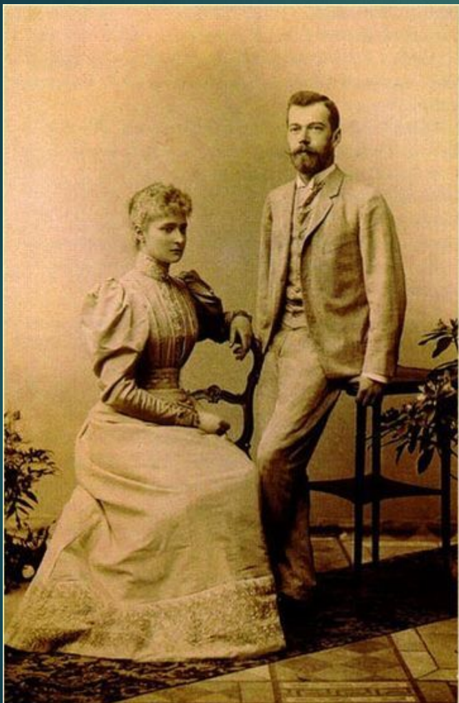
Цесаревич Николай Александрович и принцесса Алиса

Принцесса Алиса Виктория Елена Луиза Беатриса родилась 25 мая (7 июня) 1872 года в Дармштадте, столице небольшого германского герцогства, уже насильственно включенного к тому времени в Германскую империю. Отцом Алисы был Великий герцог Гессен-Дармштадтский Людвиг, а матерью — принцесса Алиса Английская, третья дочь королевы Виктории. В детстве принцесса Алиса (Аликс, как звали ее домашние) была веселым, живым ребенком, за что ее прозвали «Санни» (Солнышко). Одежда и еда детей были очень простыми. Но от дифтерии в возрасте тридцати пяти лет умерла ее мать. После пережитой трагедии (а ей было всего 6 лет) маленькая Аликс стала замкнутой, отчужденной, начала сторониться незнакомых людей; успокаивалась она только в семейном кругу. После смерти дочери королева Виктория перенесла свою любовь на ее детей, особенно на младшую, Аликс. Ее воспитание и образование проходили под контролем бабушки.