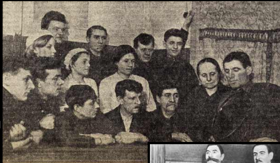
В общежитии Подшипникового завода имени Л. М. Кагановича по делу антисоветского «право-троцкистского блока».

Бухарин был одним из главных обвиняемых на показательном процессе по делу «Антисоветского правотроцкистского блока». Как почти все другие обвиняемые, признал вину и отчасти дал ожидаемые показания. В своём последнем слове, однако, сделал попытку опровергнуть возведённые на него обвинения. Хотя Бухарин все же и заявил: «Чуждоищность моих преступлений безмерна», ни в одном конкретном эпизоде он прямо не сознался