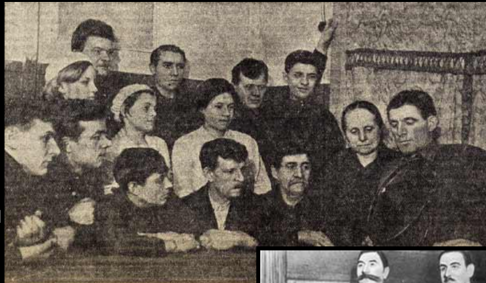
В общезнании Подшипникового завода имени Л. М. Кагановича по делу антисоветского «право-троцкистского блока».

Бухарин был одним из главных обвиняемых на показательном процессе по делу «Антисоветского правотроцкистского блока». Как почти все другие обвиняемые, признал вину и отчасти дал ожидаемые показания. В своём последнем слове, однако, сделал попытку опровергнуть возведённые на него обвинения. Хотя Бухарин все же и заявил: «Чуждость моих преступлений безмерна», ни в одном конкретном эпизоде он прямо не сознался