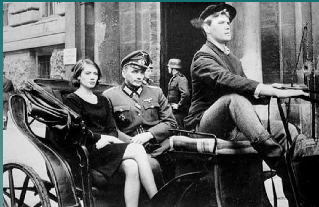
Мундир обер-лейтенанта СС Пауля Зиберта, который был использован на съемках фильма «Отряд специального назначения».