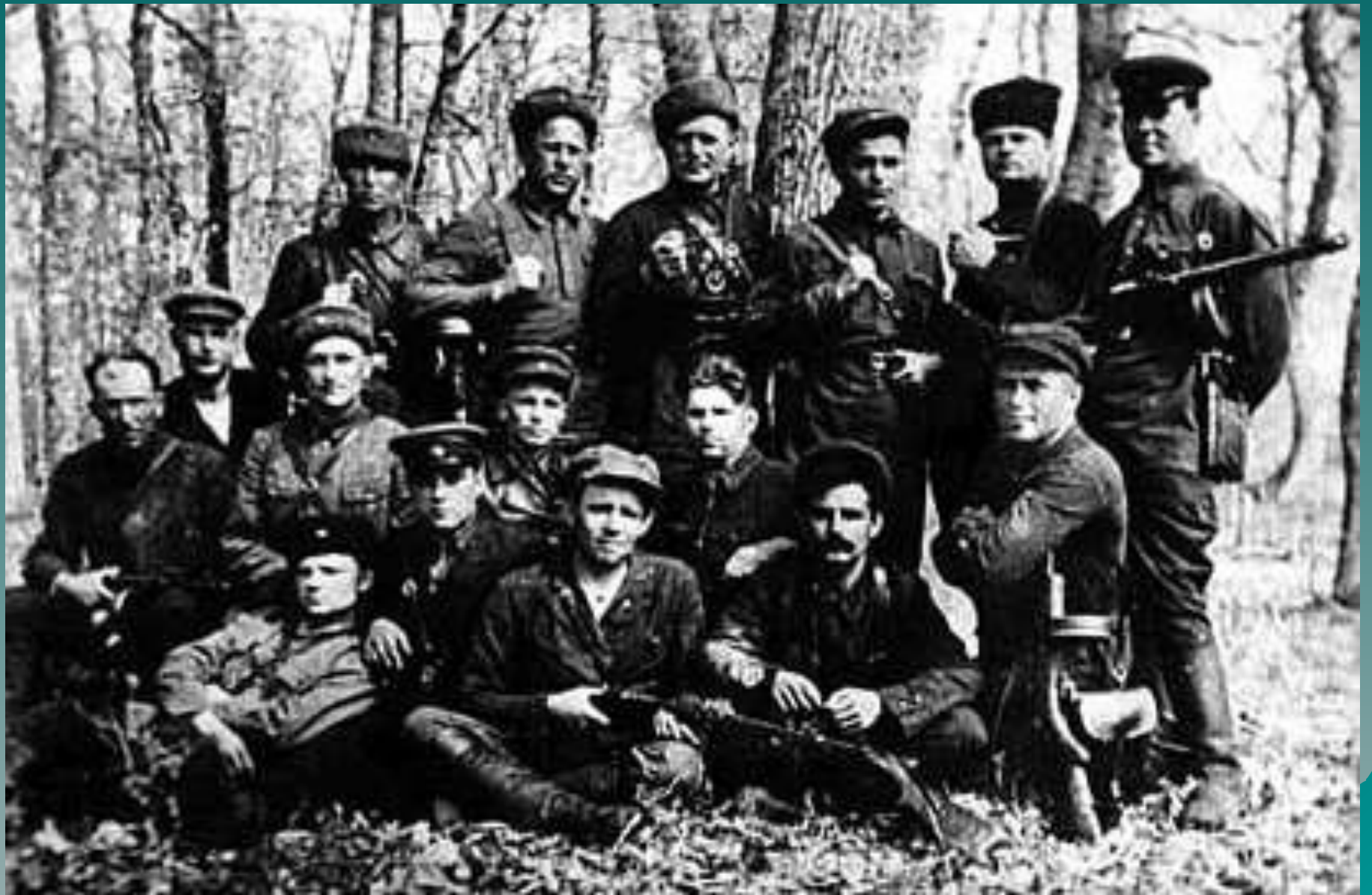
Бойцы партизанского отряда «Победители».