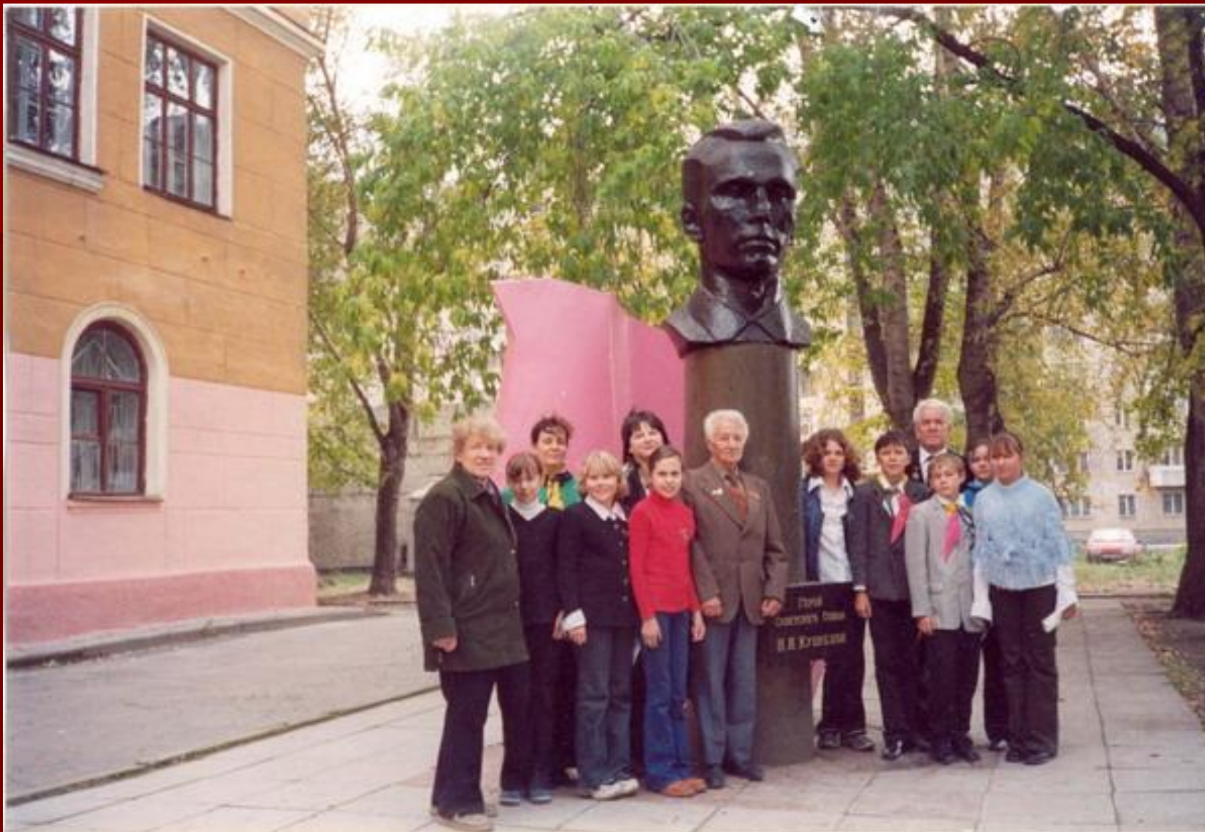
В 1964 г. жители города Талицы Свердловской области воздвигли памятник своему замечательному земляку