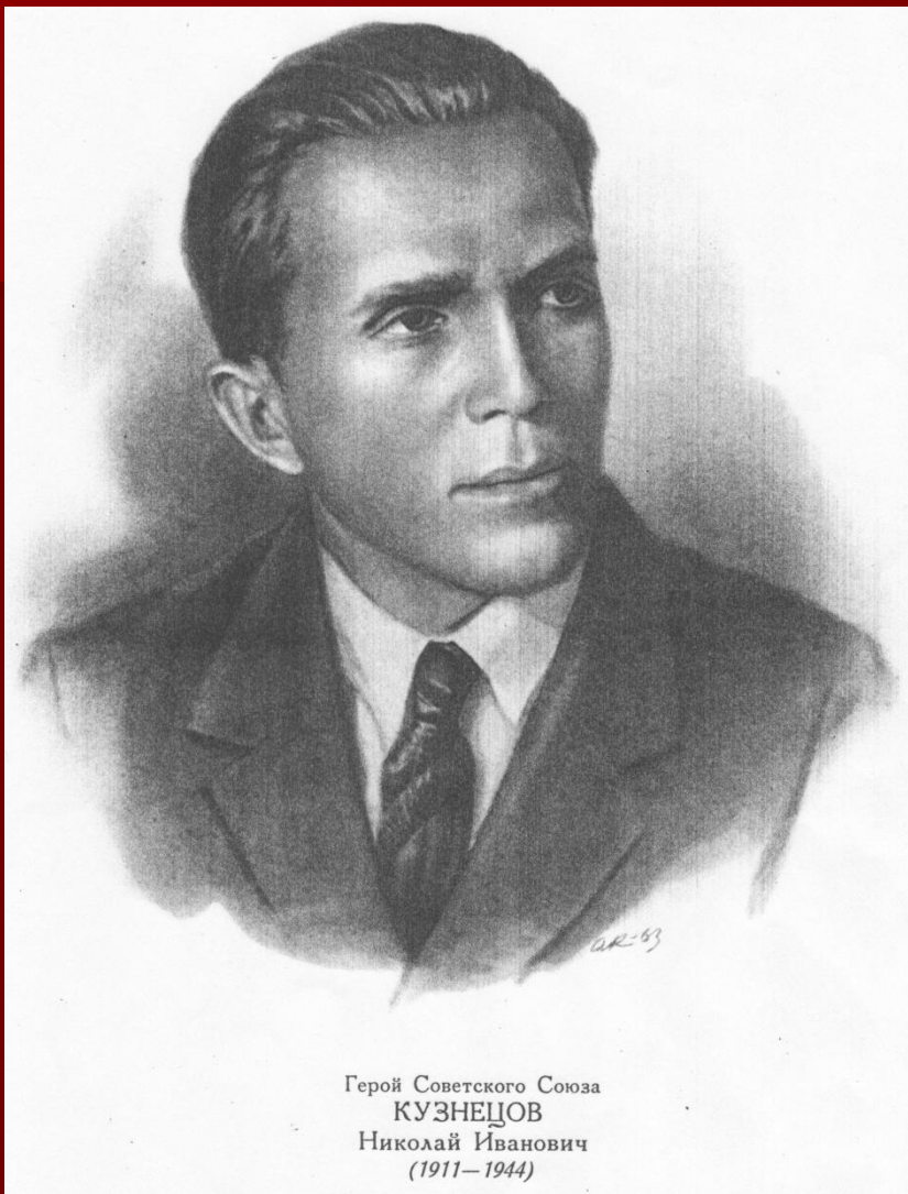
Герой Советского Союза КУЗНЕЦОВ Николай Иванович (1911—1944)

Легендарный разведчик специального партизанского отряда старший лейтенант Н. И. Кузнецов обладал исключительной выдержкой и хладнокровием. Действия его были смелыми до дерзости. Он проникал в логово врага, в фашистские штабы и учреждения. Доблестный патриот уничтожил фашистских палачей, действовавших на Украине: главного судью Функа, заместителя Коха генерала Кнута, фашиста Гея, похитил генерала фон Ильгена, командовавшего особыми карательными войсками, и др.