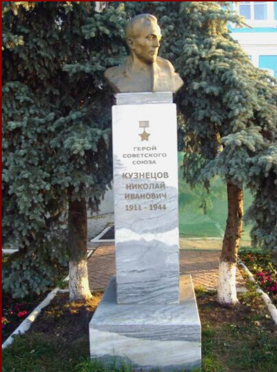
Бюст в Тюмени установлен на улице Республики, дом № 7