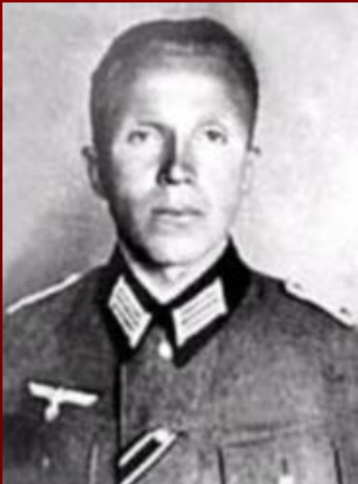
Немецкий офицер Пауль Вильгельм Зиберт