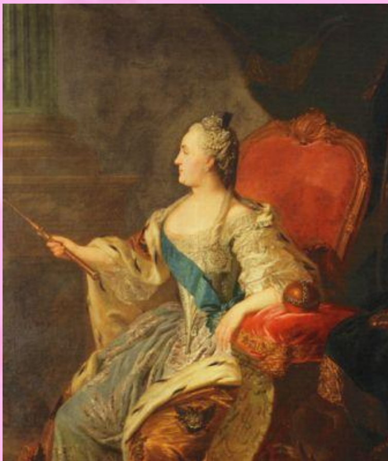
Ф.С.Рокотов. Портрет Екатерины II.