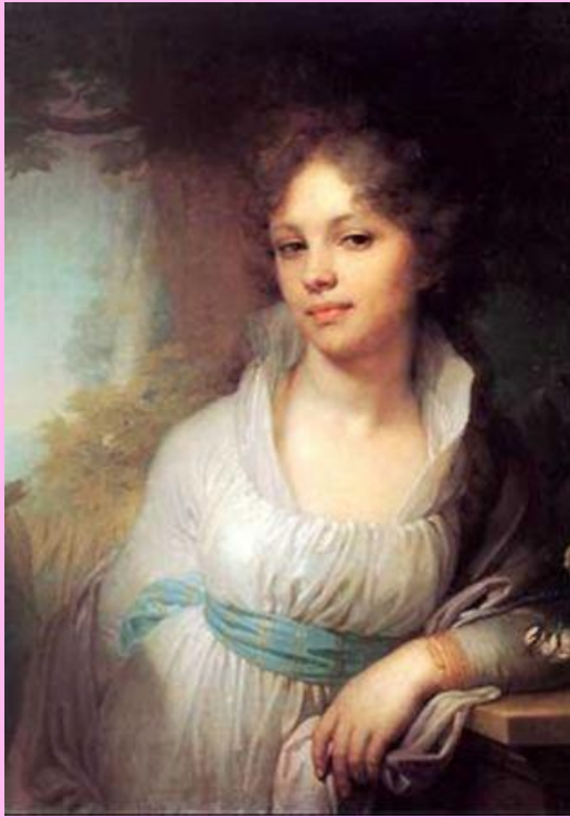
Портрет М.И. Лопухиной