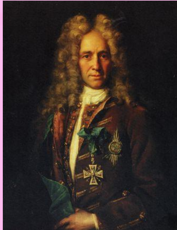
Портрет канцлера графа Г.И.Головкина