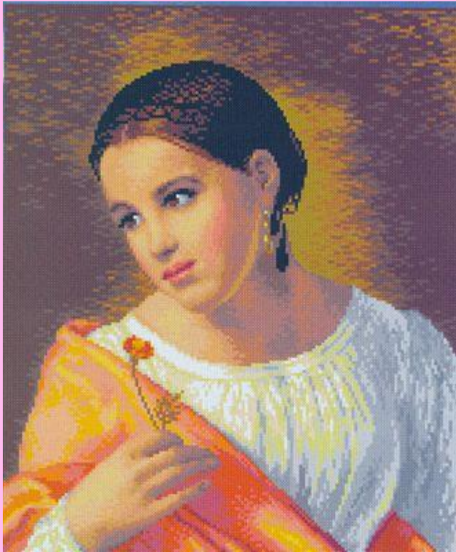
О.Кипренский. Бедная Лиза.