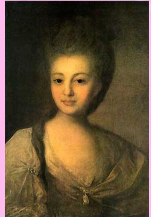
Портрет А.П. Струйской