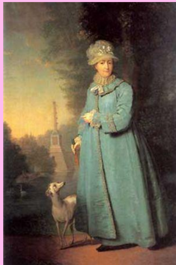
В.Боровиковский. Екатерина II.