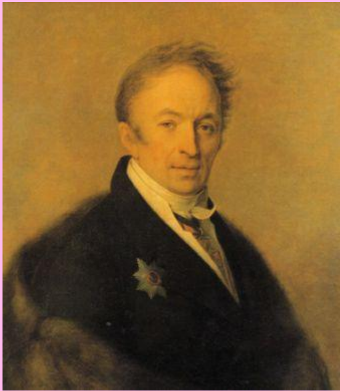
Н.М.Карамзин. Худ. А.Г. Венецианов. 1828