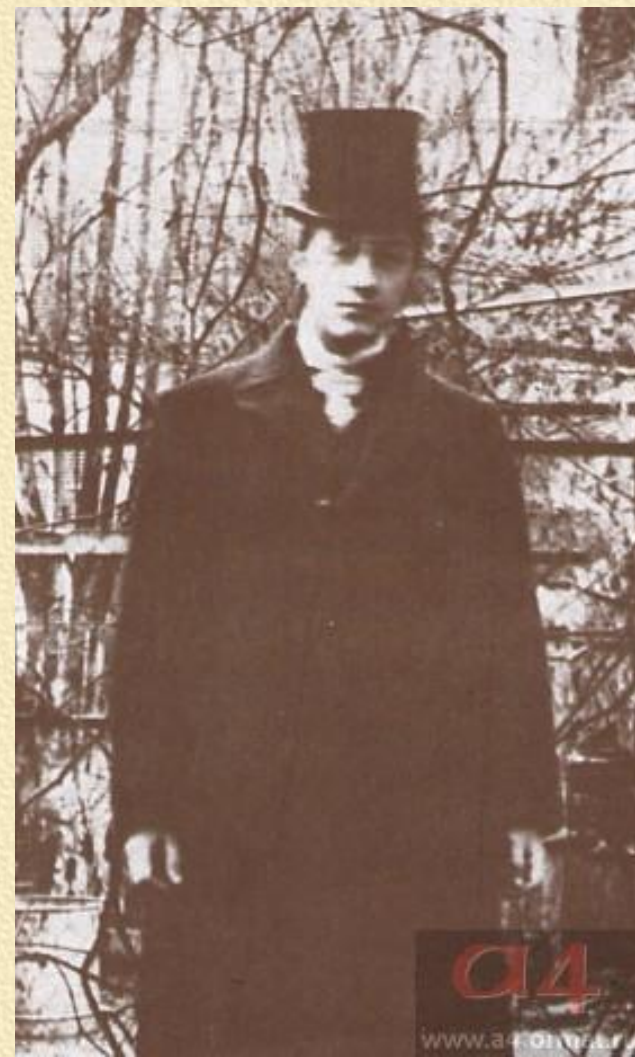
Н. Гумилёв в Париже

Николая Гумилева всегда тянуло в заморские страны , ему хотелось увидеть все, испытать новые чувства, а затем оформить свои впечатления в стихи. Он уехал в Париж , «душа требовала расстояний и впечатлений». Париж стал для Гумилева вторым домом . Сюда он приезжал очень часто, но стихи раздаривал другим городам, которые затмевали образ привычного Парижа.