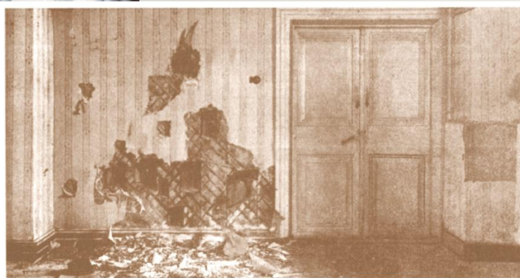
Комната в подвальном этаже дома Ипатьева, где были убиты члены царской семьи и их приближенные