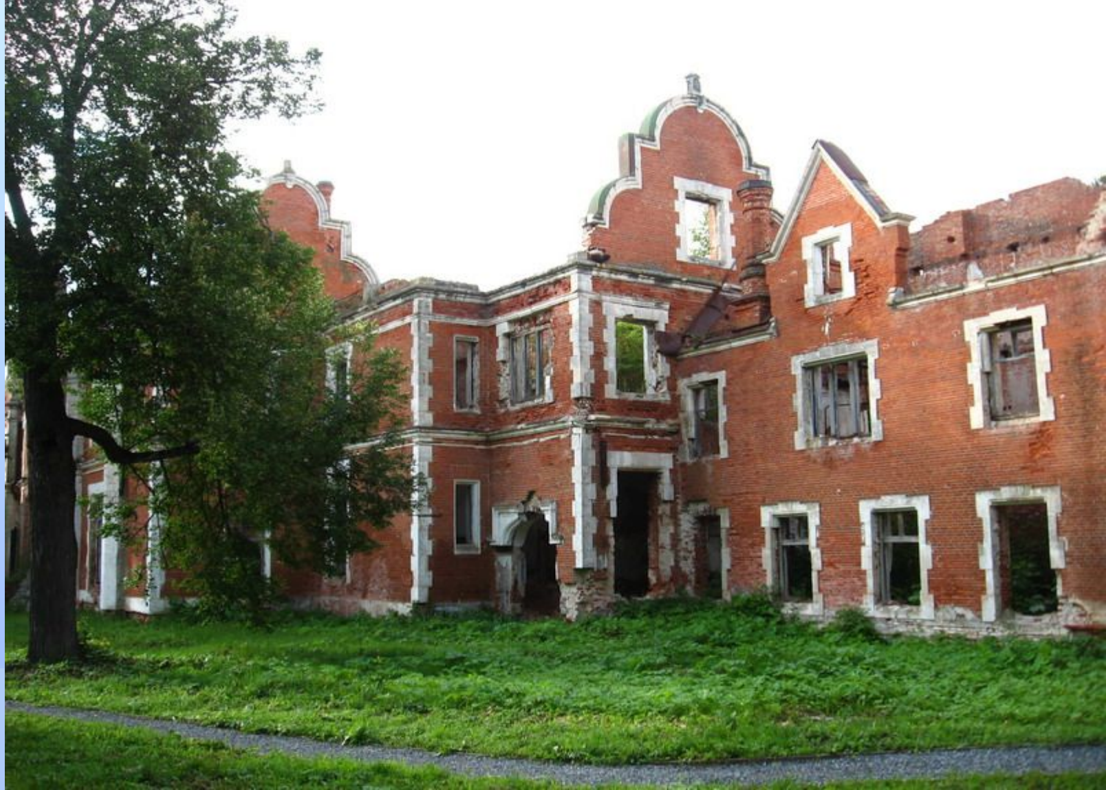
Усадьба Пашковых в Ветошкине