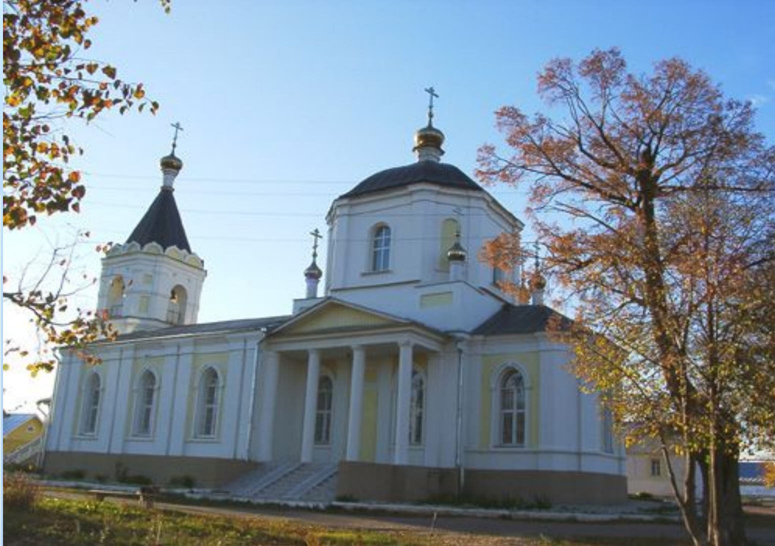
Усадьба Улыбышевых в Лукине