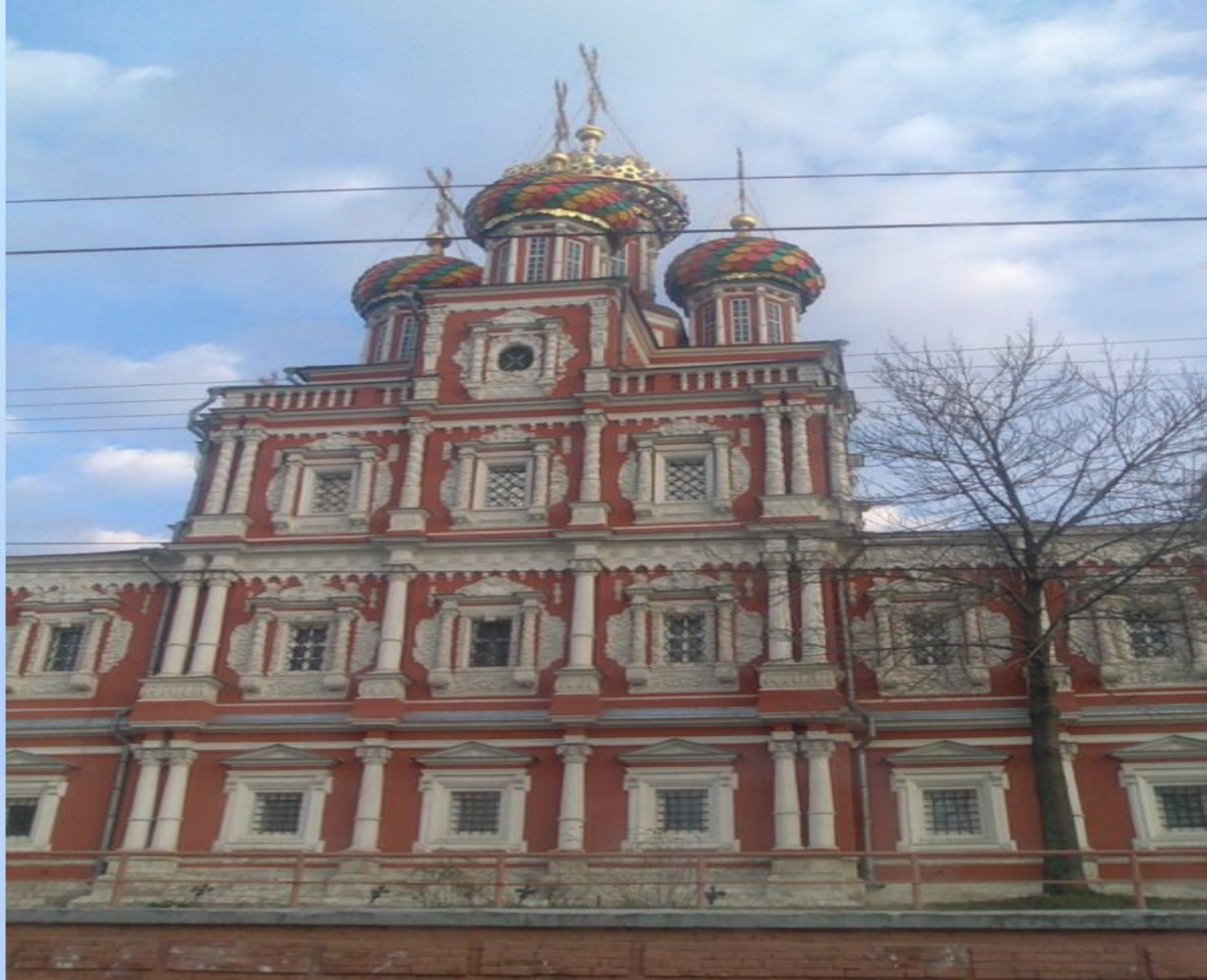
Рождественская церковь при усадьбе Строгановых