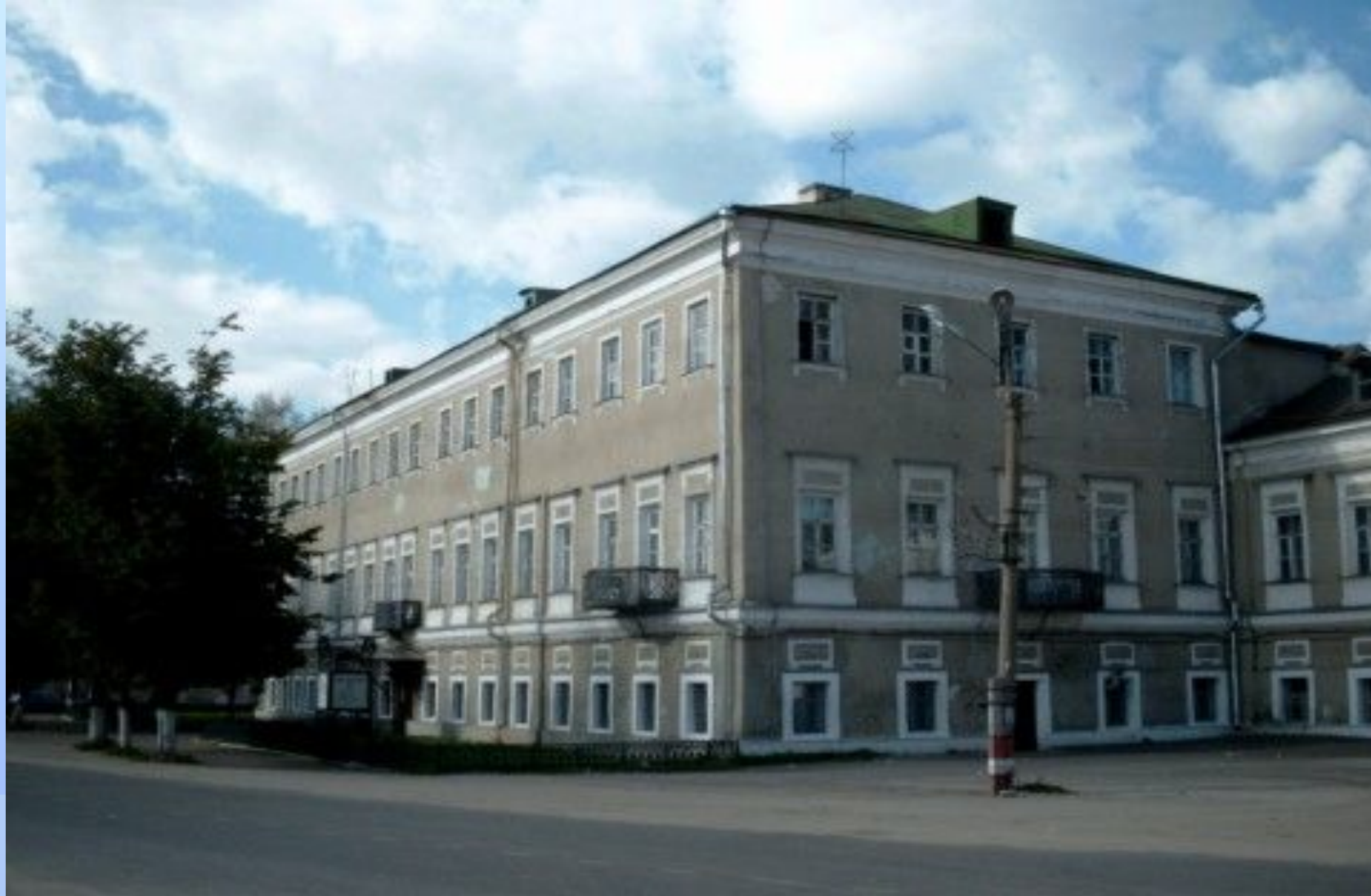
Усадьба И.Р. Баташева в Выксе