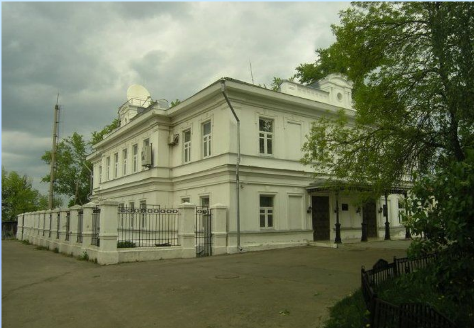
Усадьба Г.А. Грузинского в Лыскове