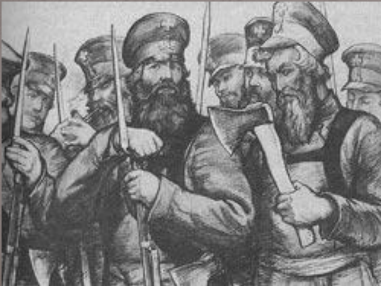
Ополченцы в 1812 г. Художник И. Архипов

Командный состав ополчения набирался из дворян. Основную массу ратников составляли крепостные крестьяне, во всех шести губерниях III округа была установлена единая норма – четыре ратника со 100 ревизских душ. Рядовые ратники зачислялись по принципу «здоров и крепок и на защиту способен». Кроме крестьян в ополчение набирали семинаристов, представителей духовенства, учителей.