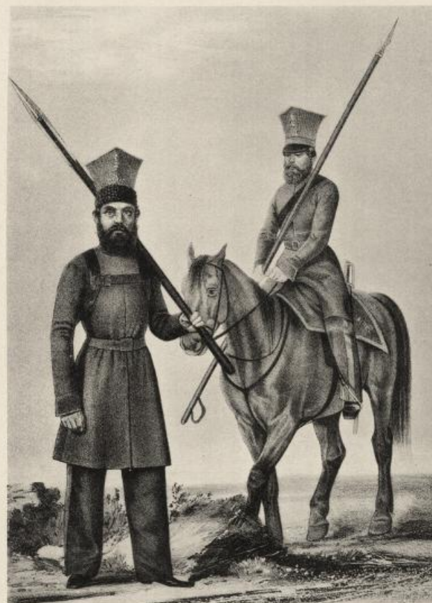
ПЕШИЙ И КОННЫЙ ВОИНЫ Нижегородского ополчения, 1812-1818.

9 декабря 1812 года Нижегородское ополчение в составе 5 пехотных полков и одного конного двинулось на Арзамас. В этом городе проходил смотр войск, а потом все ополчение в составе около 13 тысяч нижегородцев было направлено в действующую армию. Путь ополченцев лежал через Муром, Рязань, Орел - на Украину.