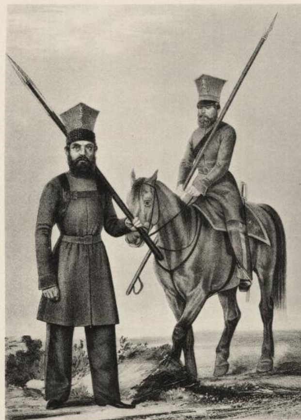
ПЕШИЙ И КОННЫЙ ВОИНЫ Нижегородского ополчения, 1812-1818.

9 декабря 1812 года Нижегородское ополчение в составе 5 пехотных полков и одного конного двинулось на Арзамас. В этом городе проходил смотр войск, а потом все ополчение в составе около 13 тысяч нижегородцев было направлено в действующую армию. Путь ополченцев лежал через Муром, Рязань, Орел - на Украину.