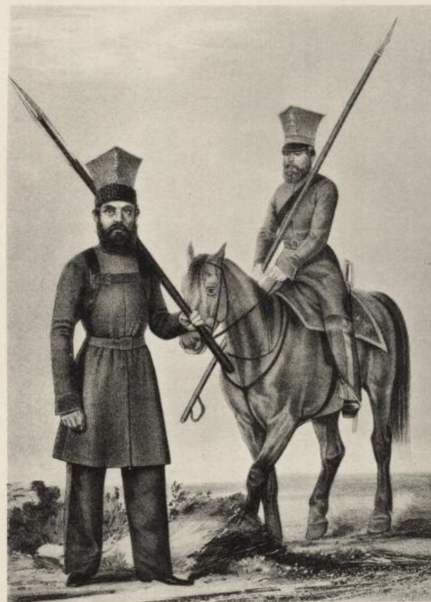
ПЕШЫЙ И КОННЫЙ ВОИНЫ Нижегородскаго ополченія, 1812-1818.

9 декабря 1812 года Нижегородское ополчение в составе 5 пехотных полков и одного конного двинулось на Арзамас. В этом городе проходил смотр войск, а потом все ополчение в составе около 13 тысяч нижегородцев было направлено в действующую армию. Путь ополченцев лежал через Муром, Рязань, Орел - на Украину.