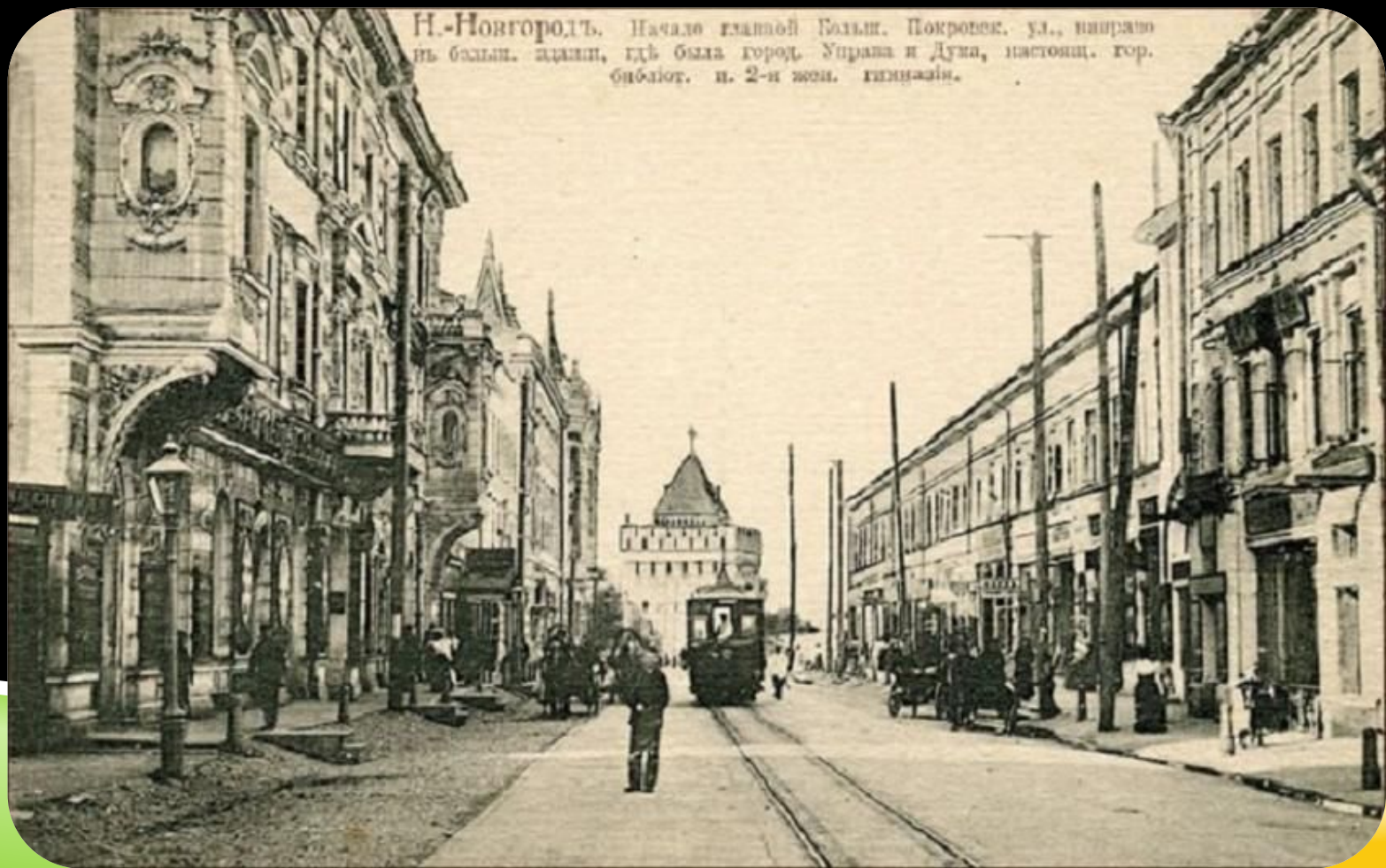
Н.-Новгородъ. Начало главной Болыш. Покровск. ул., направо въ базил. здании, гдѣ была город. Управа и Дума, направо. гор. библиот. н. 2-й жон. гимназии.

▶ В 1817 году из Макарьева на левый берег Оки была перенесена крупнейшая на то время в России торговая ярмарка, стимулировавшая дальнейшее развитие Нижнего и окрестностей. Обустройством ярмарочного городка занимался знаменитый зодчий и инженер А.А. Бетанкур.