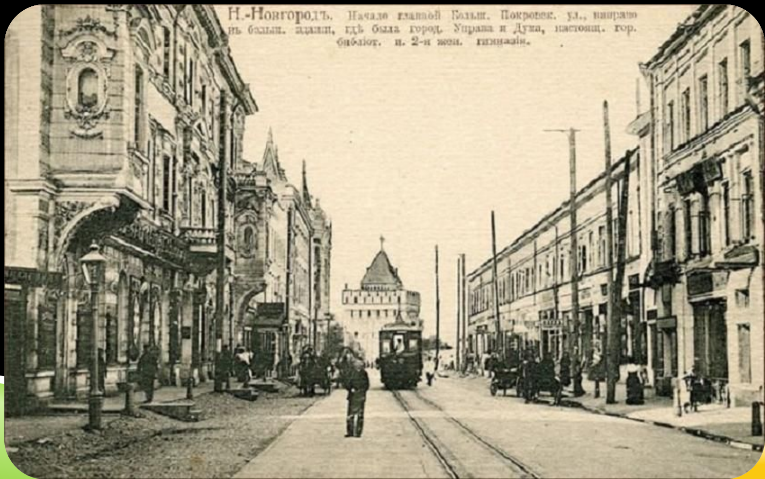
Н.-Новгородъ. Начало главной Болыи. Покровск. ул., направо въ базил. здании, гдѣ была город. Управа и Дума, направо. гор. библиот. н. 2-и жем. гимназии.

▶ В 1817 году из Макарьева на левый берег Оки была перенесена крупнейшая на то время в России торговая ярмарка, стимулировавшая дальнейшее развитие Нижнего и окрестностей. Обустройством ярмарочного городка занимался знаменитый зодчий и инженер А.А. Бетанкур.