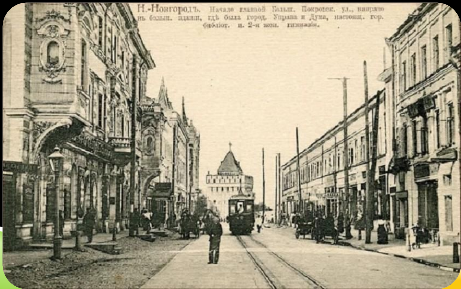
Н.-Новгородъ. Начало главной Болыи. Покровск. ул., направо въ базил. здании, гдѣ была город. Управа и Дума, направо. гор. библиот. н. 2-и жем. гимназия.

▶ В 1817 году из Макарьева на левый берег Оки была перенесена крупнейшая на то время в России торговая ярмарка, стимулировавшая дальнейшее развитие Нижнего и окрестностей. Обустройством ярмарочного городка занимался знаменитый зодчий и инженер А.А. Бетанкур.