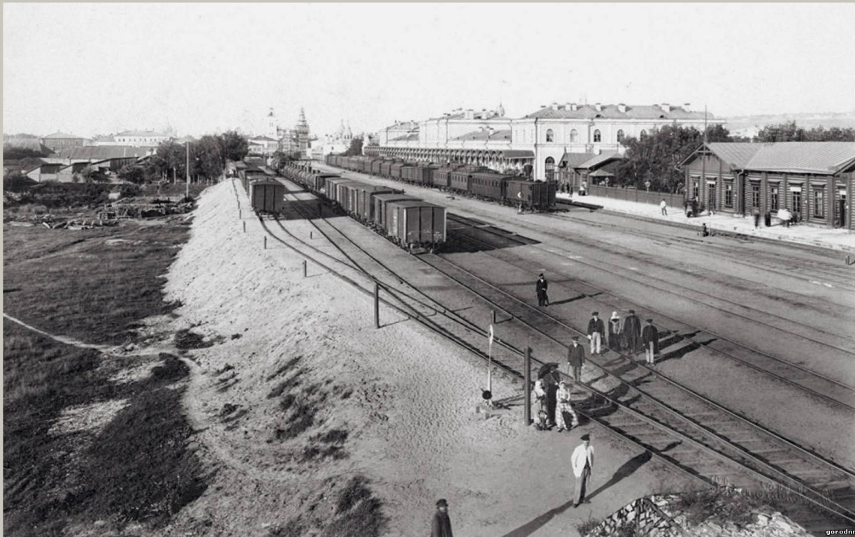
Станция Нижний Новгород. Главные железнодорожные ворота города глазами приезжающих. Конец 90-х годов XIX века.

В октябре 1856 года Высочайшим соизволением Императора Александра II строительство железной дороги между Москвой и Нижним было одобрено. В начале 1857 года образовалось Главное Общество Российских железных дорог, в число которых была включена и Московско-Нижегородская. В том же 1865 году нижегородская станция занимала второе место (после Москвы) по обслуживанию пассажиров. Так, прибыло – 131679 человек, отправлено – 103 233 человека.