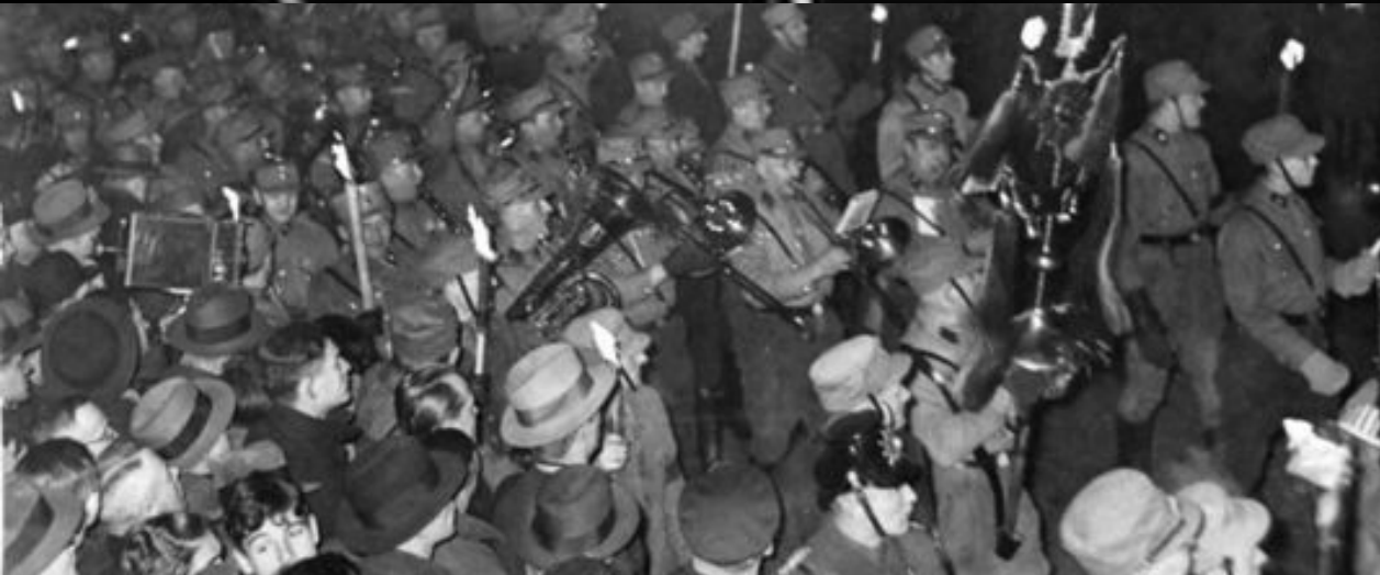
30. Januar 1933