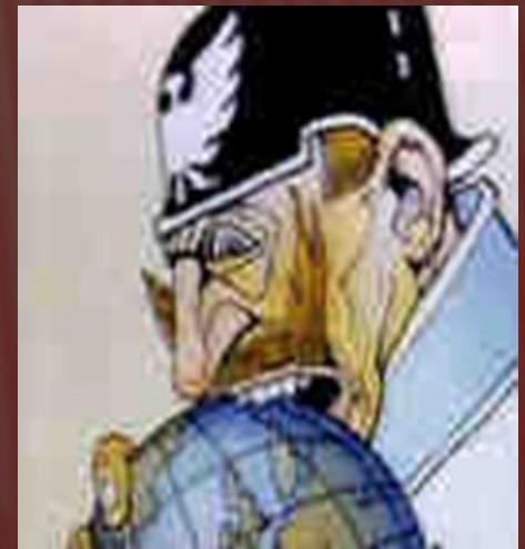
Карикатура на світові зазіхання Вільгельма II