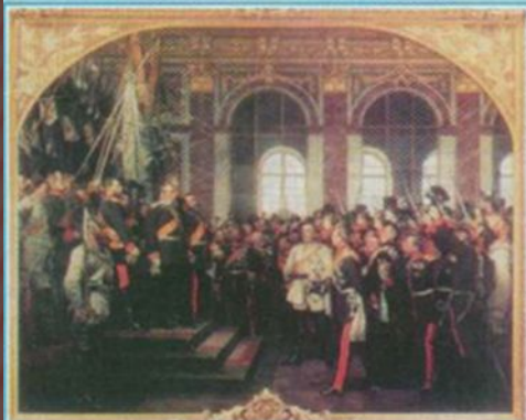
Проголошення Німецької імперії (Версаль, 1871 р.)