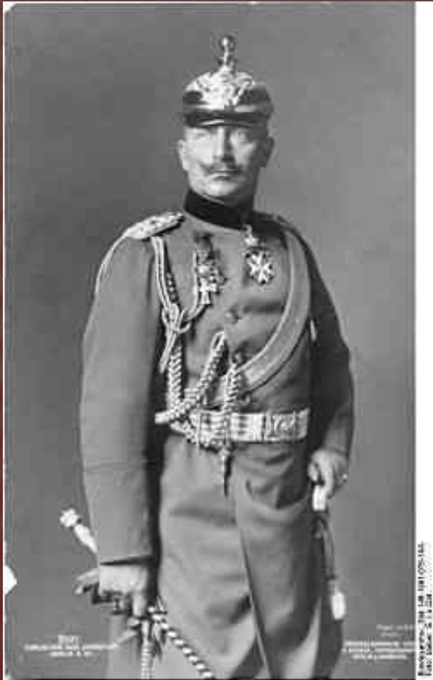
Вільгельм II Гогенцоллерн