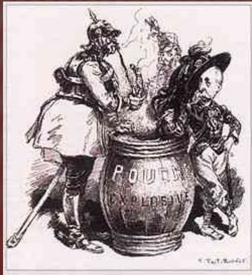
Карикатура Тире-Боне. Троїстий союз.