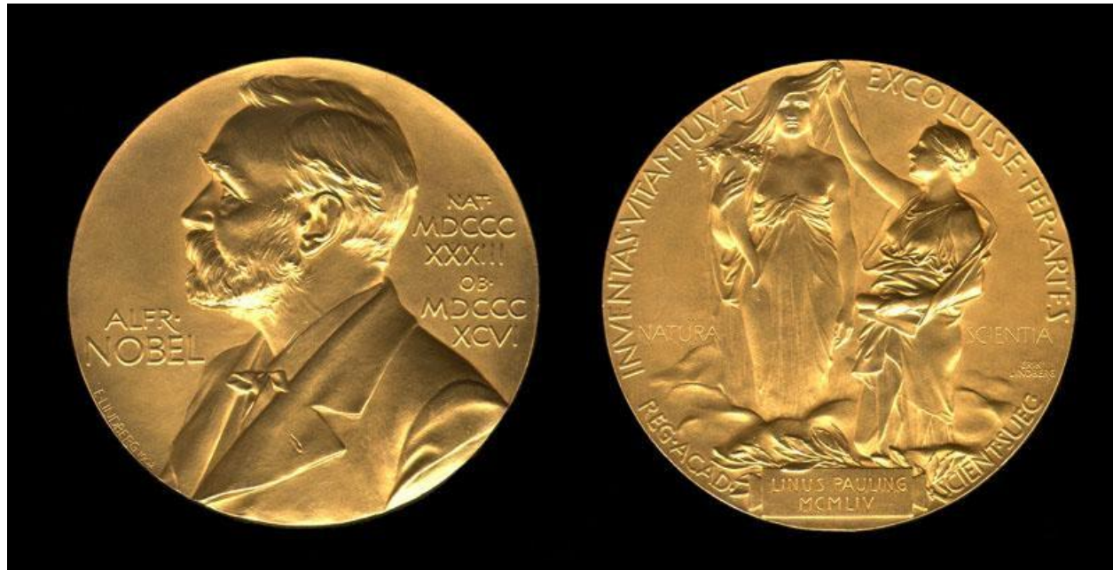
Медаль, вручаемая лауреату Нобелевской премии.

Нобелевская премия - одна из наиболее престижных международных премий, присуждаемая за выдающиеся научные исследования, революционные изобретения или крупный вклад в культуру или развитие общества.