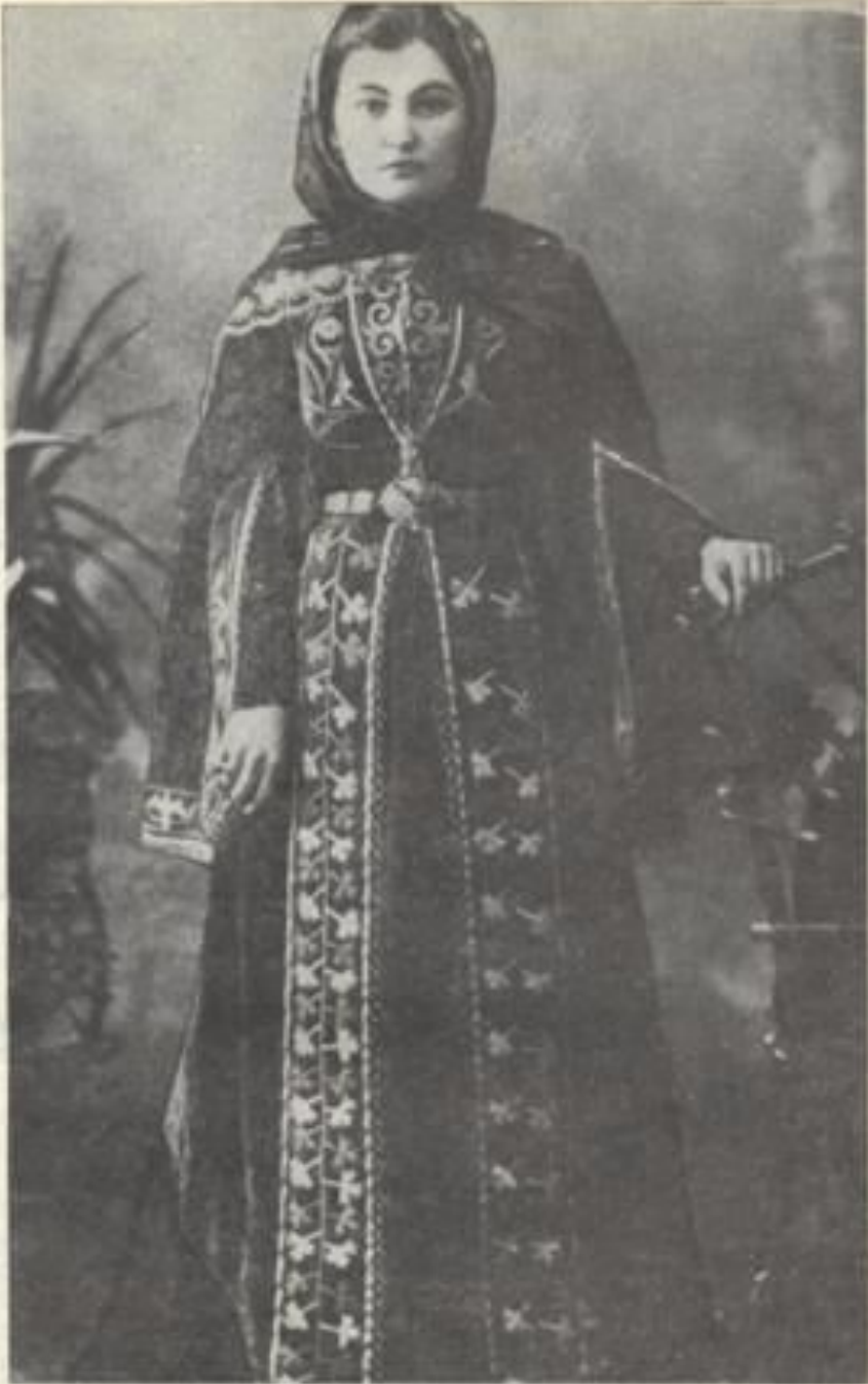
Кубанская вояка в праздничном наряде. Начало XIX в.

Женский костюм по покрою близок к мужскому; он включал платье-рубаху (ич коьйлек), различные типы платьев (зыбын, къаптал и др.), шубы (тон), шапочки из меха или ткани, платки, косынки, обувь из шерсти, кожи, сафьяна, а также пояса и различные виды украшений. В настоящее время молодое и среднее поколение женщин носит городскую, старшее, особенно сельские,- нередко традиционную одежду.