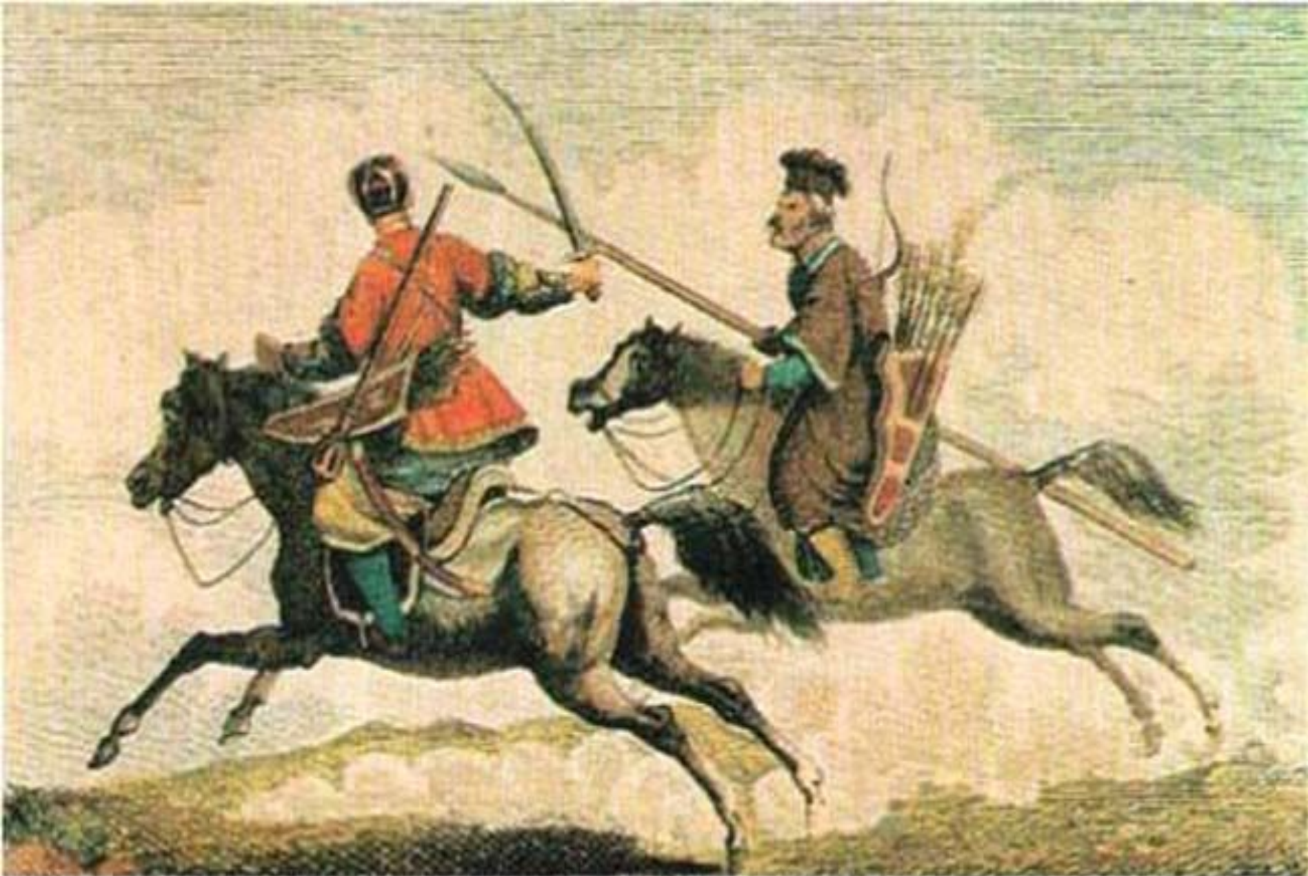
"Кубанские татары имеют совершенно отличную от других форму. Их офицеры носят между двумя кафтанами кольчугу. На голове у них ребристая шапка. Их обычное вооружение, кроме пики и лука со стрелами, - кривая турецкая сабля и палица с длинной ручкой" (том 3, стр. 123).