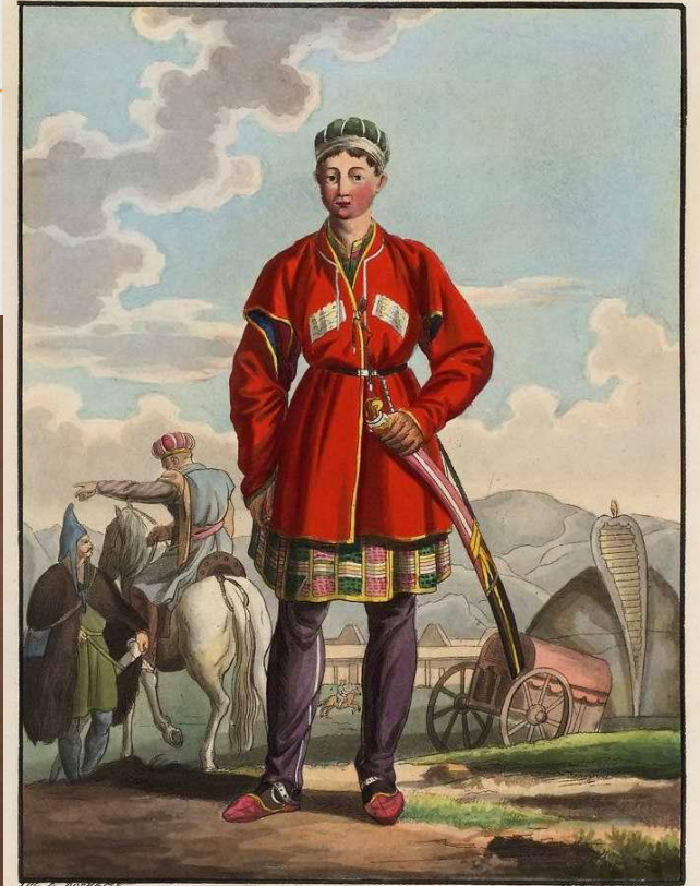
Князь нагайчукъ Мамайъ. Prince des tartares Nogais. Des. par E. Koenigst. Grav. par E. Seelischoff.