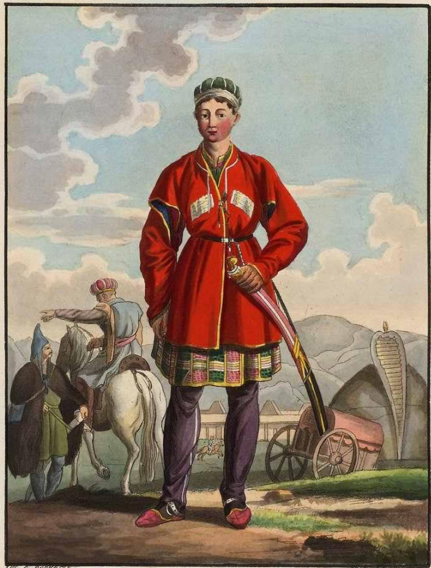
Князь нагайчукъ Мамайъ. Prince des tartares Nogais. Des. par E. Koenigst. Grav. par E. Seeliskoff.