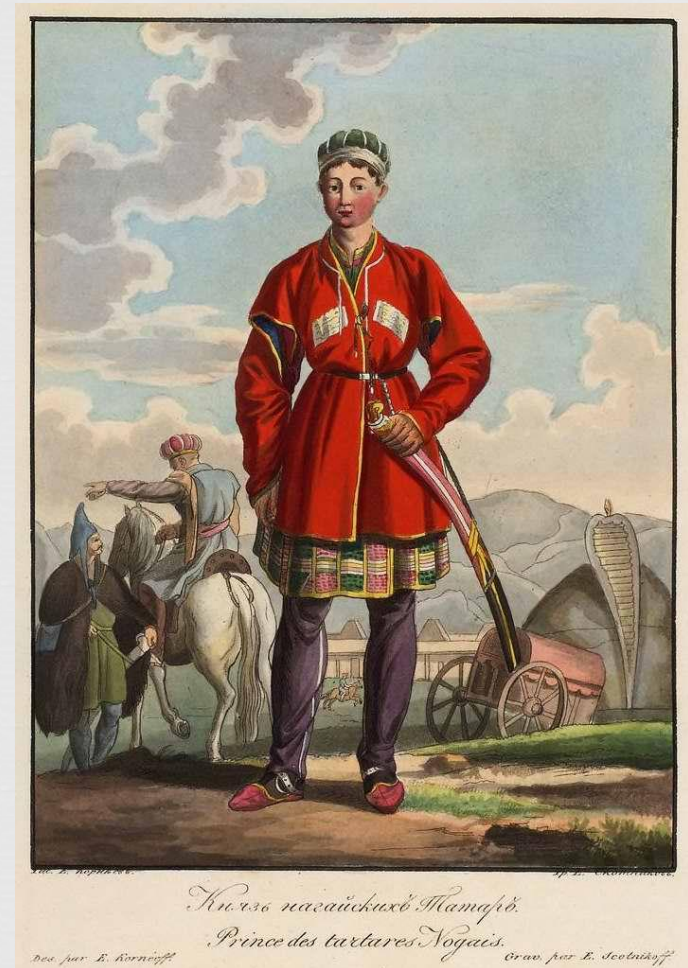
Князь татари́къ Мамафи́й. Prince des tartares Mamfiy.